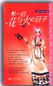
《那一段花与火的日子》