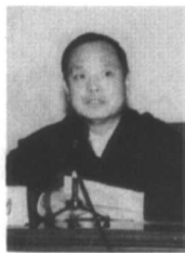
◀黄勇 国家广电总局副总编辑

北广,我的光荣与梦想! 高等教育的发展要体现世界性的“普遍智慧”和民族性的“特殊智慧”。/141