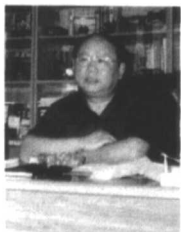
◀李丹 中国国际广播电台台长