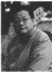
▶刘长乐 凤凰卫视董事局主席

不唯上,只唯实, 岂只写东风? 关心民生,贴近民意,才能提高报纸公信力,从边缘走向主流。/205