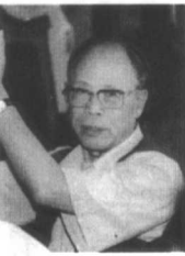
▶杜导正 原国家新闻出版署署长