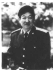
◀江永红 解放军报副总编辑

如切如磋广电曲 亦官亦学真本色 只有功底扎实,才能锻炼成为高素质、高水平的新闻人才。/159