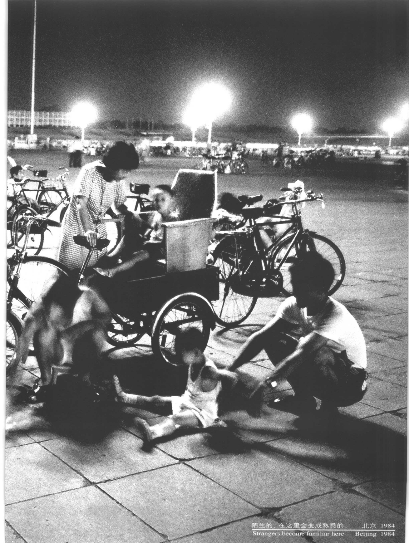
陌生的，在这里会变成熟悉的。 北京 1984 Strangers become familiar here Beijing 1984