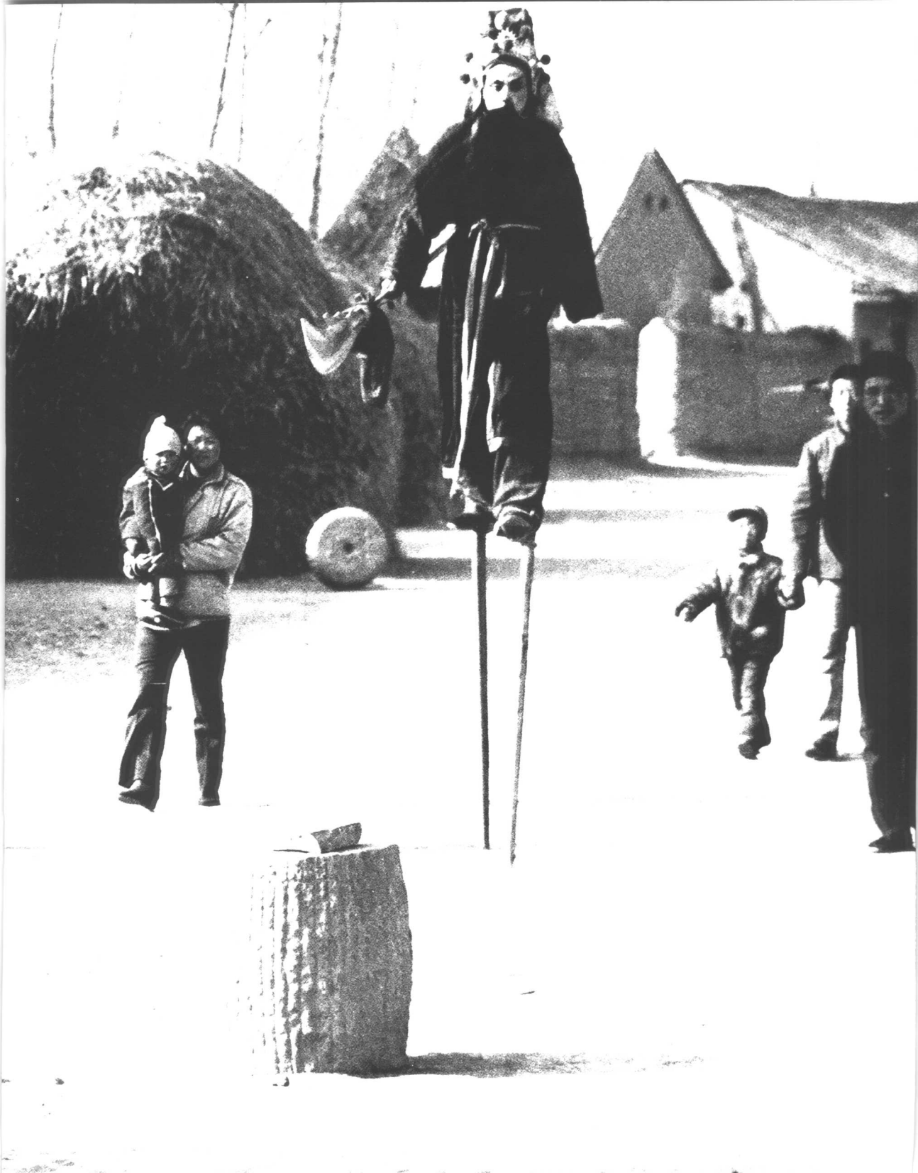
关公走高跷，单于做先锋。 甘肃 1992

A bicycle is the pioneer of ancient general Guan Gong Gansu 1992