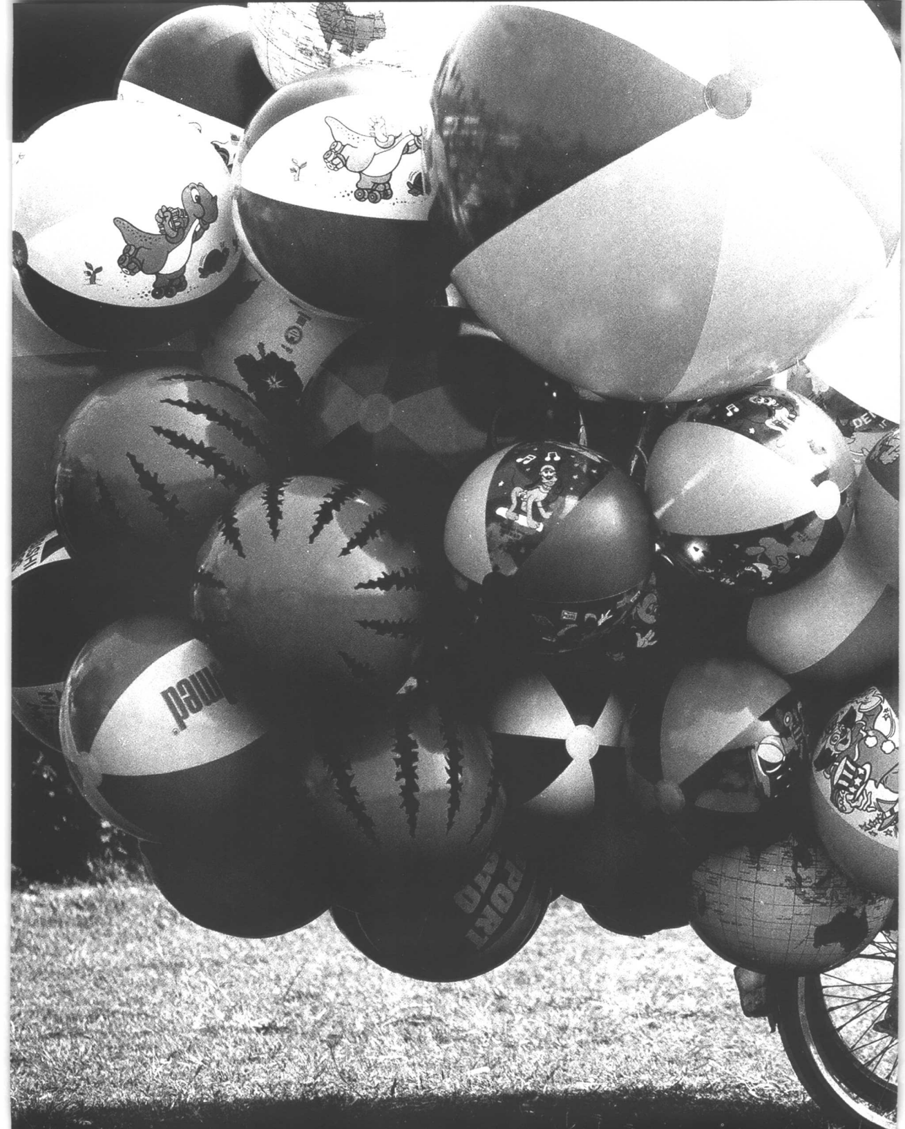
自行车自述：“再多点我就上天了。” 台湾 1997 More balloons, and I will be flying, says the bicycle. Taiwan 1997