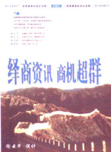
绎商资讯有限责任公司宣传样本的封面