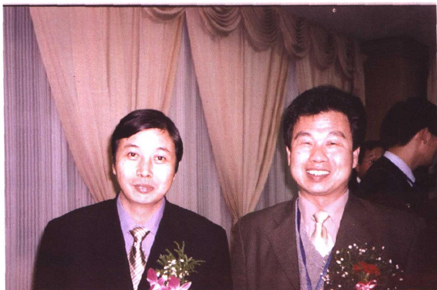
史教授与著名的华西村的领导人在一起