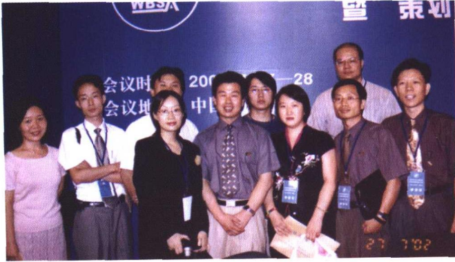
WBSA深圳机构的策划师与史教授在WBSA中国区理事会上