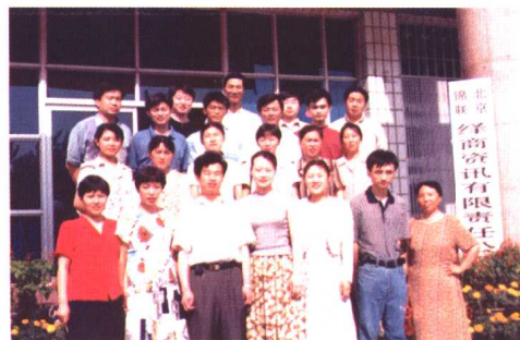
绎商总部全体员工合影