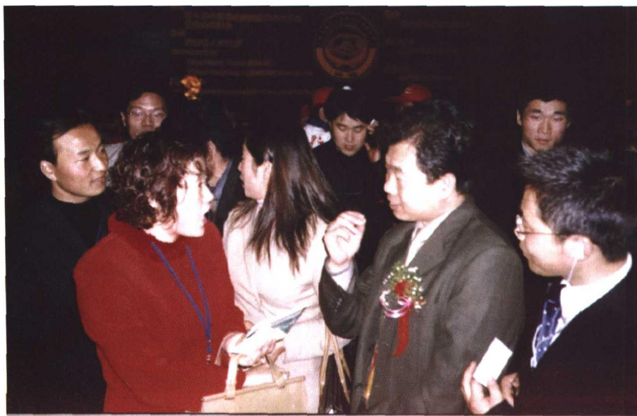
史教授在农高会论坛现场答疑