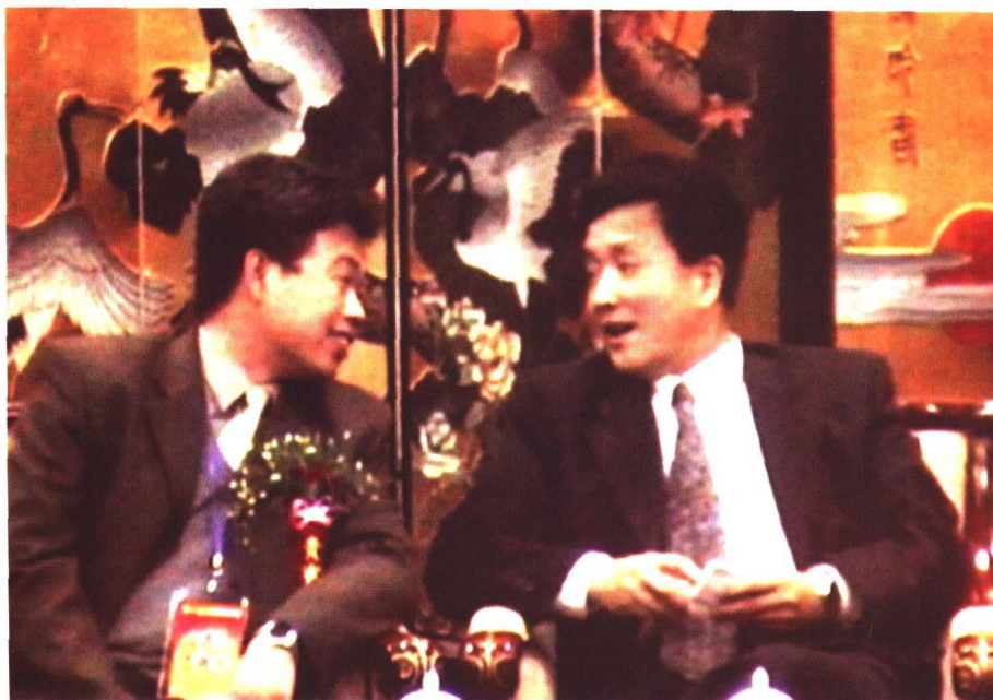
史教授与陕西省政府领导在交谈