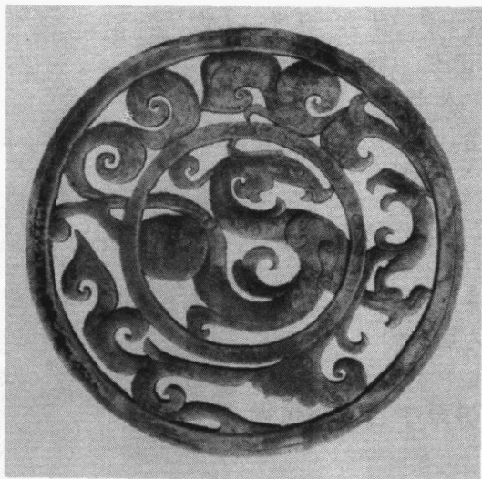
西汉龙凤纹重环玉佩

汉高祖三年（前 204），刘邦的军队打垮了项羽封立的魏国，把魏王豹的宫人掳到荥阳，要她们织布。有一次刘邦闲逛到了织布的房子，见一女子有些姿色，就把她要进了后宫。这个女子姓薄，也就是文帝刘恒的生母。刘邦把薄氏要到后宫，转脸就把她忘了。过了一年，楚汉战争形势好转后，刘邦有了闲心，与管夫人、赵子儿两个美人取乐。这两个美人是与薄氏一起从魏宫被掳来的，而且彼此都很要好，当初曾相约“富贵莫相忘”。她们把与薄氏的约言当笑料说给刘邦听，刘邦听了心下慨然，一丝怜悯之意生了出来，当天就把薄氏召了来“幸之”。随后，薄氏于汉高祖五年生了刘恒。