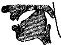
圖七 k, r

『嘎』《γ (ra)》中有此音，不同之處，即俄文 r 的發音更短促有力，空氣更急劇地衝開發音器官（帶有聲息）。