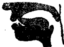
圖一二 Т. А

А. 舌尖緊貼上齒，以空氣的壓力把它們衝開，同時聲帶振動。此音近似於中國注音符號「ㄉ」，不同之處，即發俄文 А 音空氣更加急劇地衝開發音器官。