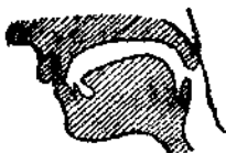
圖十四 Ф, В

這個音近似於中國注音符號『ㄨ』，但是在發俄文 В 音時，發音器官的動作更要有力一些。