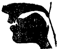
圖十五 ш, ж

Ж. 舌葉稍微抬向上顎，形成狹窄縫隙，以便空氣從喉部出來，這樣便構成此音，發音時聲帶振動（即濁音），此音近似於中國注音符號『ㄓ』，但俄文 ж 的發音更強些。