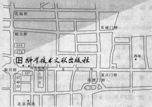
科学技术文献出版社方位示意图