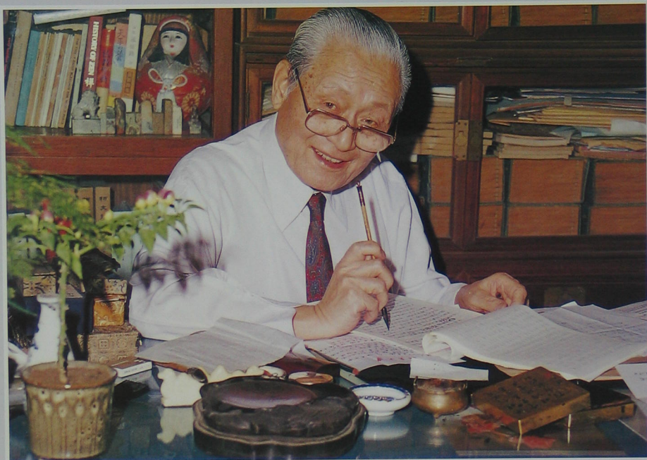
作者在北京西城寓所書齋