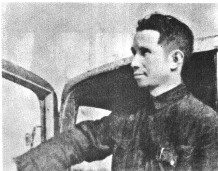
指挥七战七捷时的粟裕。