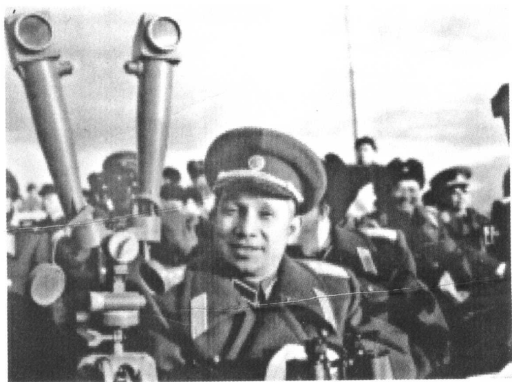
1955年11月，总参谋长粟裕在大连观看军事演习。