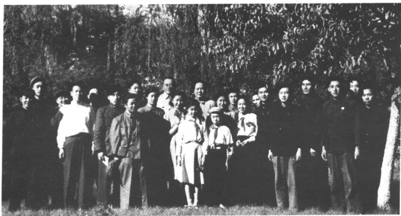
1953年5月30日,在北京玉泉山毛主席与身边工作人员及家属合影。 左起:王振海、王博文、叶子龙、王鹤滨、汪东兴、李家骥、徐业夫、李德华、 刘思齐、罗瑞卿、李讷、叶利亚、毛主席、毛远新、李敏、李银桥、叶燕、李云露、 申虎成、张仙朋、孙勇、吴秃海等人