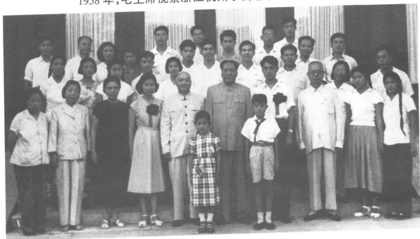
1959年8月28日，毛主席在中南海丰泽园颐年堂参加李敏与孔令华的婚礼。第一排邓颖超（左二）、蔡畅（左三），孔从周（左五），王季范（左八）；第二排毛远志（右二），王启华（左四）、王海容（左五）