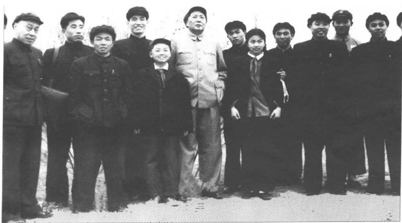
1954年4月15日,毛主席与工作人员在北京玉渊潭公园合影。 左起:周泽昭、李家骥、徐业夫、孙勇、毛远新、毛主席、李银桥、叶利亚、 王振海、汪东兴、郭计祥、张耀祠