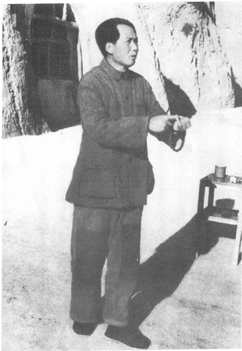
1942年,毛主席在延安给八路军一二〇师干部作报告。