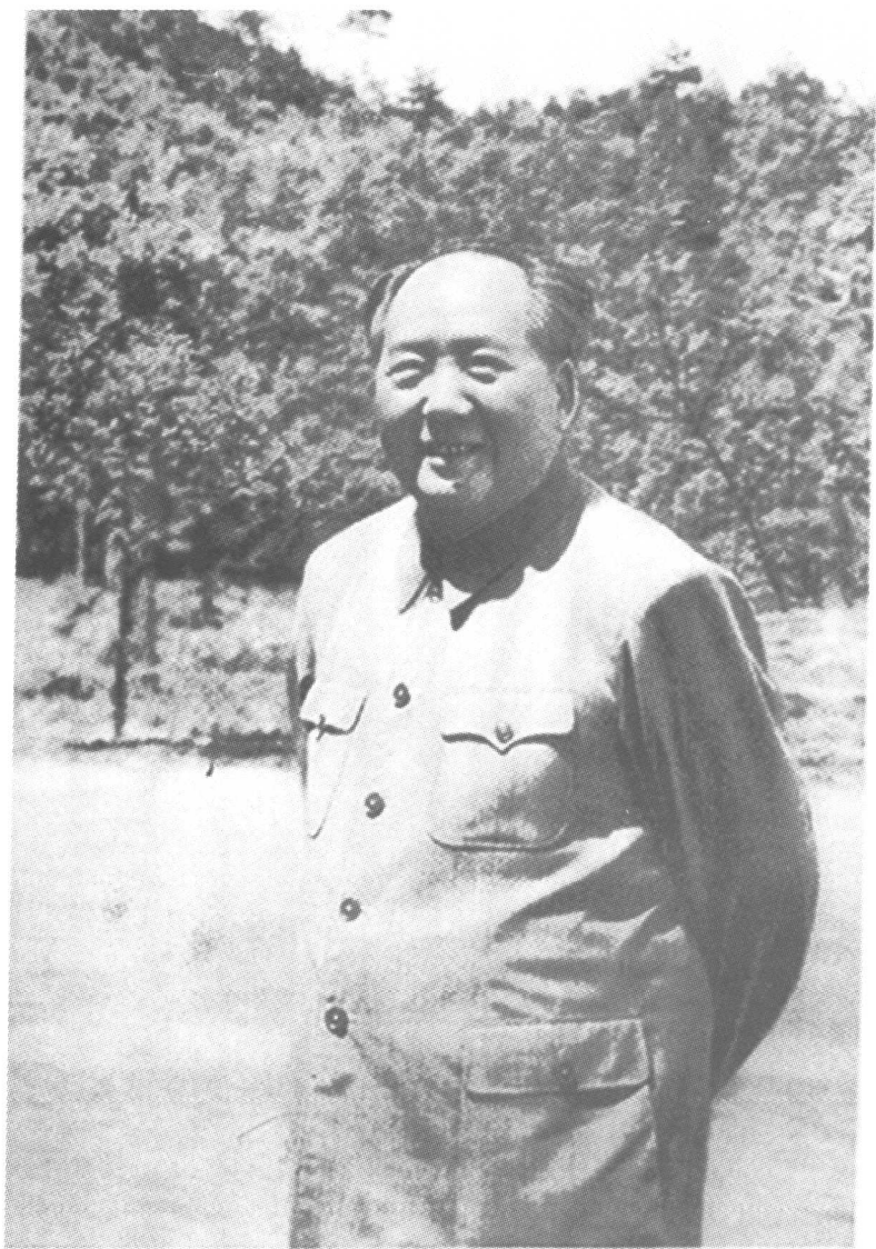
1965年,毛主席重上井冈山。