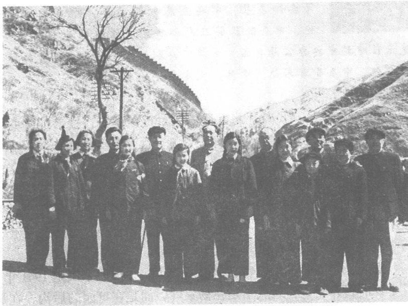
1954年，毛主席与杨尚昆（右三）、程潜（左六）、王季范（右六）等在南口。

在这个过程中，中央分配我担任了一些工作，先是政策委员会的委员；1942年又参加中央调查研究局党务研究室的工作，研究室主任是副局长任弼时兼的。1943年，中央调整和精简机构，成立由毛泽东、刘少奇和任弼时三人组成的书记处，下面设组织和宣传两个委员会和中央研究局。宣传委员会书记是毛主席，组织委员会书记是少奇同志，委员有任弼时、王稼祥、康生、陈云、张闻天、邓发和我，并由我担任委员会秘书。中央研究局由刘少奇兼任局长，我是副局长。对各抗日根据地的指导，中央也作了统一分工。当时，周恩来同志在重庆主持南方局的工作。中央决定由王稼祥负责华北，刘少奇负责华中，任弼时负责陕甘宁和晋西北，陈云负责大后方，我负责敌占区的工作。这些同志直接对书记处负责。北方局书记的名义尽管仍由我挂着，实际工作由彭德怀同志代理。