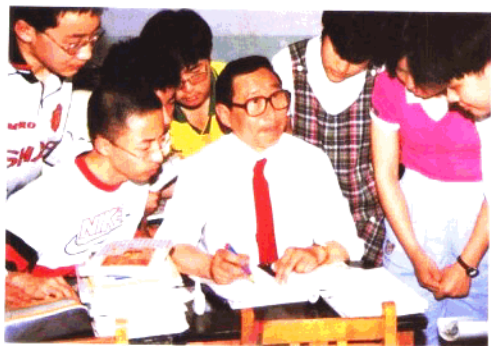
与学生一起探究 数学问题