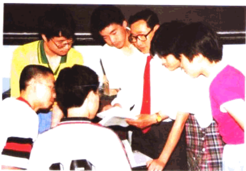
建构数学知识 把师生联结在一起