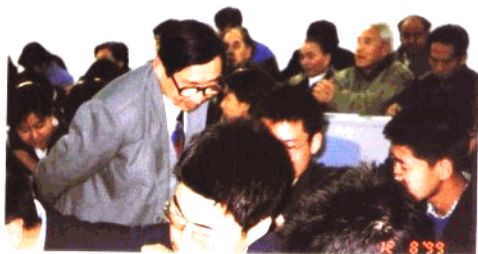
示范课中查看学生掌握情况