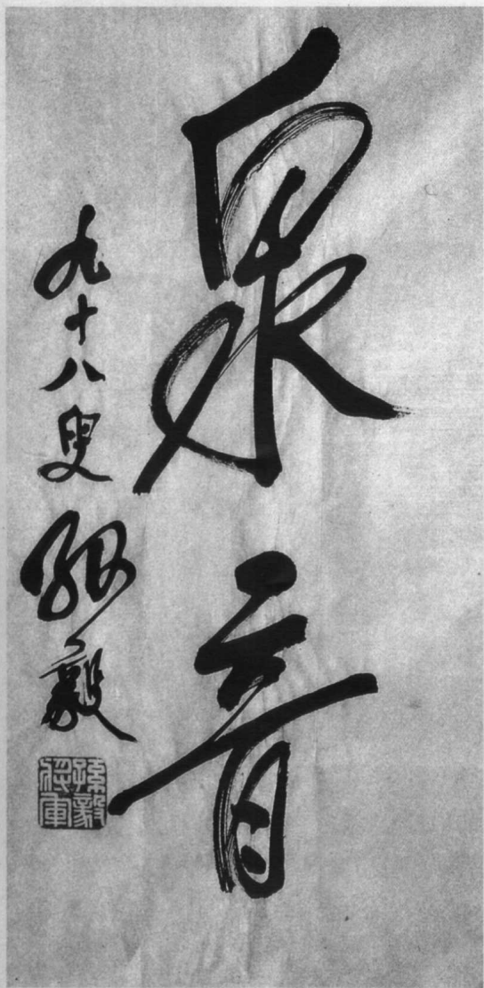
孙毅书 (作者笔名 泉音)