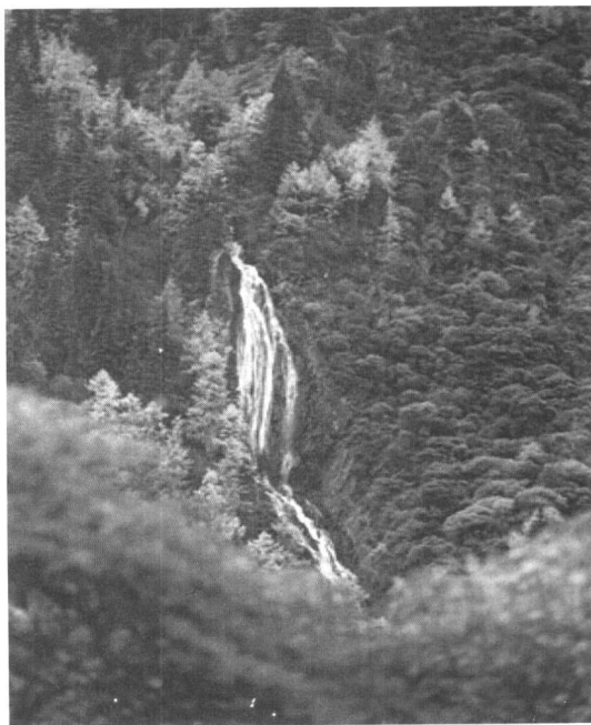
输电线路于今年 3 月 20 日全线竣工，4 月

正是在中央领导的关心、全国人民的关注下，川电东送加快了进程。2000 年 10 月 10 日，三峡至重庆万州 500 千伏输电线路工程，在国家电力公司的积极支持下正式开工，标志着川电东送的输电通道建设进入了最后攻坚阶段。在此之前，四川的 500 千伏超高压输电通道已由自贡经重庆直达万州，湖北葛洲坝至上海也已有 500 千伏直流输电通道，两大电网之间被群山峡谷阻隔，急需连接起来。经过上千名建设者近一年半的紧张施工，三峡至万州 380 千米长的 500 千伏