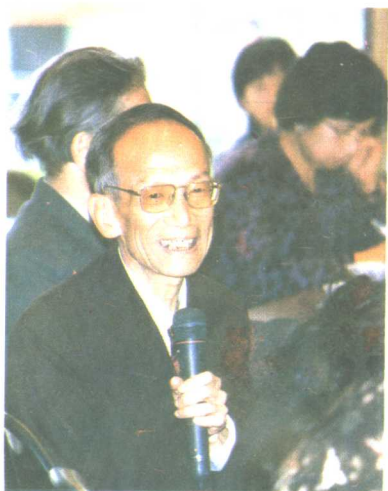
一九九〇年在一次国际儿童文学研讨会上