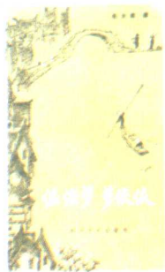
作者部分作品的封面