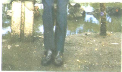
一九八九年在吉林通化