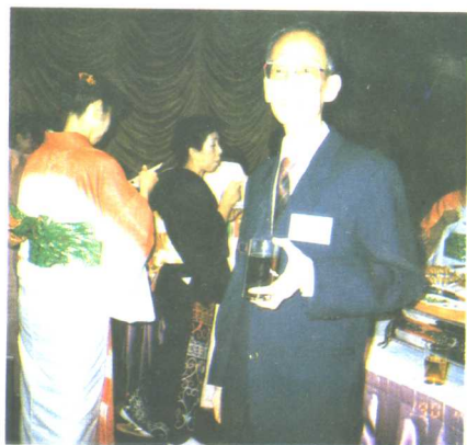
一九九〇年在日本大阪参加文艺招待会