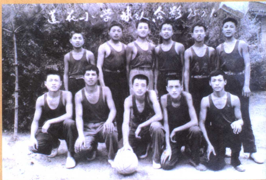
1975年莲花小学球队合影