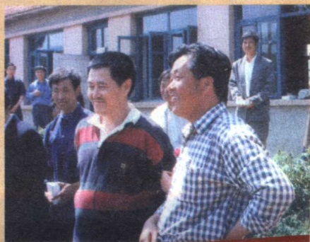
作者和本山不同时期合影