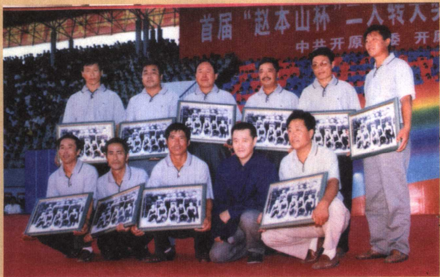
25年后，球队的队员又相聚在一起