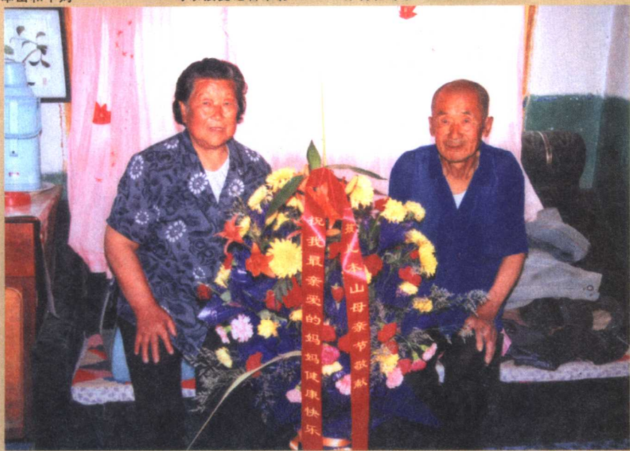
母亲节本山送来花篮