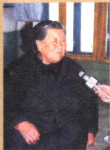
母亲接受记者采访