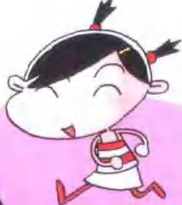
我就是大美女小樱桃!