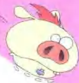
我是小樱桃的宠物肥肉男。