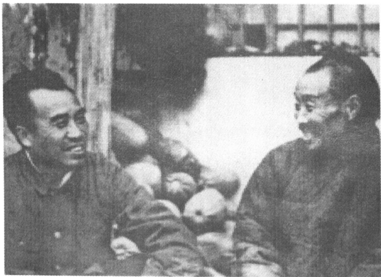
解放战争时期，朱德总司令和延安农民亲切交谈。