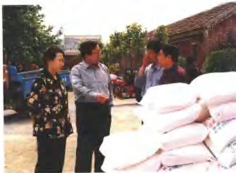
区政府积极做好救灾工作，为灾区群众送粮