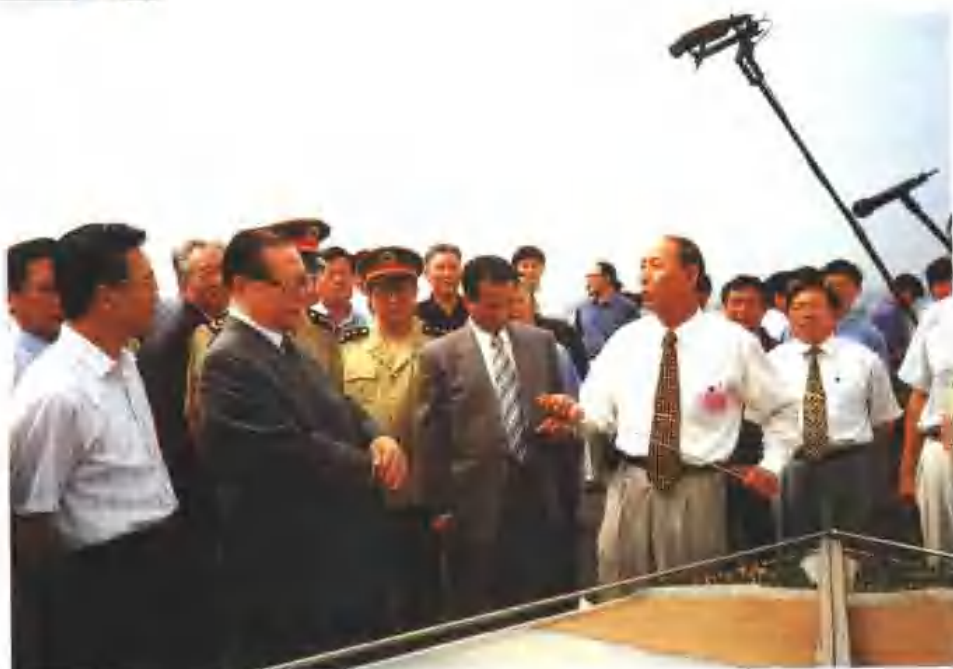
江泽民、温家宝、吴官正等党和国家领导人视察黄河济南泺口段