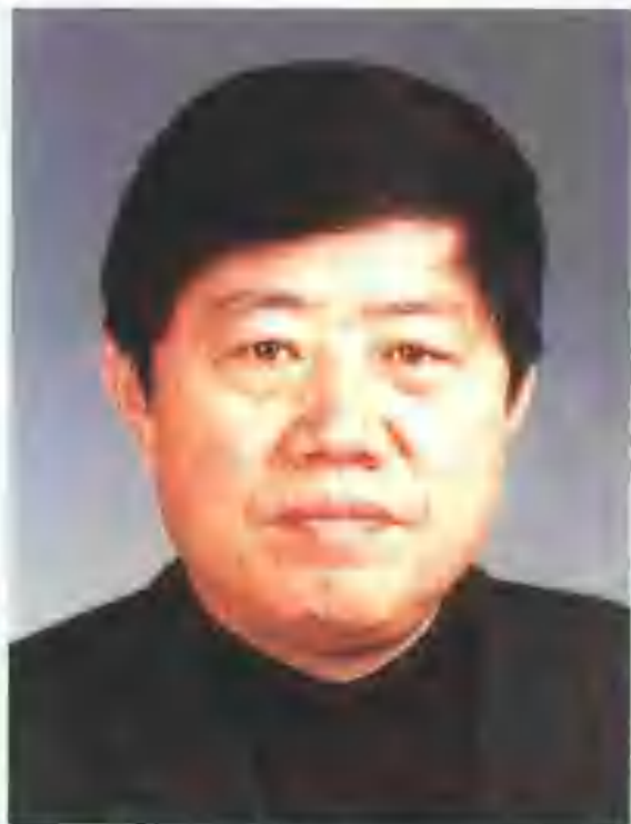
中共天桥区委书记 杨庆林