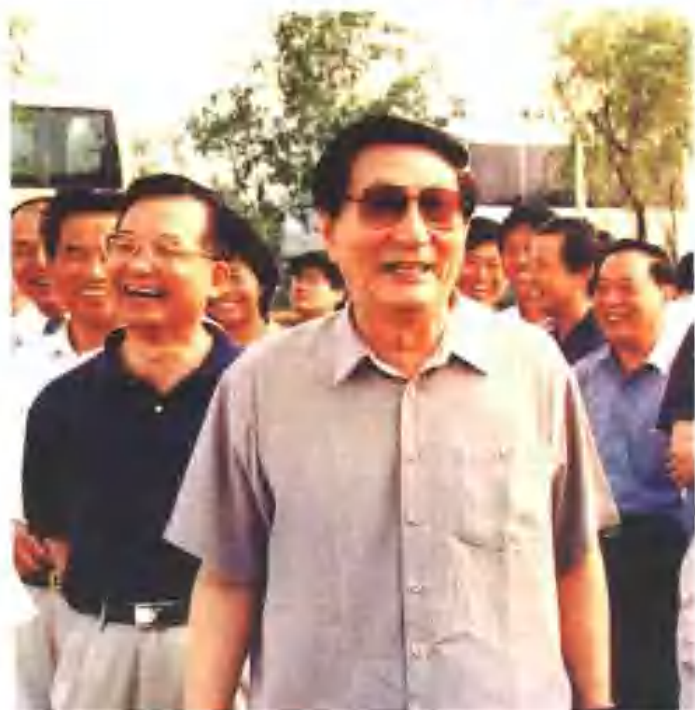
2002年7月8日，朱镕基总理和温家宝副总理考察济南泺口段险工4号坝，图为朱总理幽默的话语使气氛轻松活跃