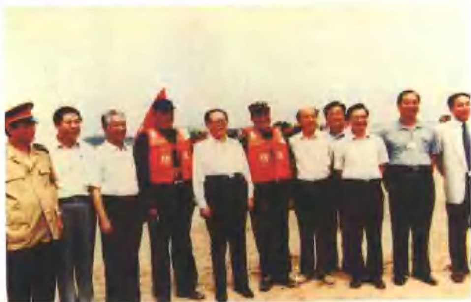
1999年8月23日上午，江泽民总书记检阅了山东省第一机动专业抢险队（天桥区河务局承担），图为江总书记（左五）等领导与队员代表赵长河（左四）合影留念