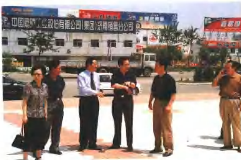
人大领导视察药山工业园