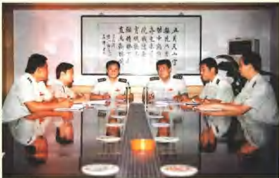
区人武装部领导班子

天桥区人民武装部与时俱进、开拓创新，圆满完成了上级赋予的民兵整组、民兵征集、军事训练、黄河防汛、国防教育、民兵带建和扶贫帮困等各项任务，争得了荣誉。1999年，为迎接江泽民总书记视察黄河防汛工作，组织40名民兵进行了黄河防汛演练，受到江总书记亲切接见。2001年8月，女子民兵高炮连在山东省组织的淮北靶场高炮实弹射击中，获得第一名。2002年12月，被山东省军区评为先进团级党委和“一对好主官”。2003年6月，区政府被省国防教育办公室评为国防建设“十佳”先进单位。