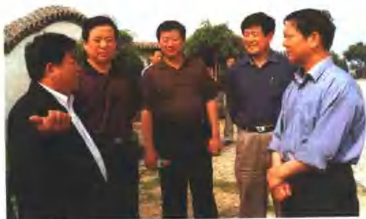
市政协主席徐华东视察药山工业园