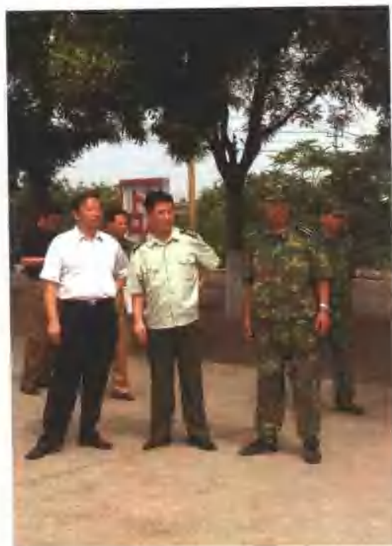
区委、区政府领导走访慰问驻区部队