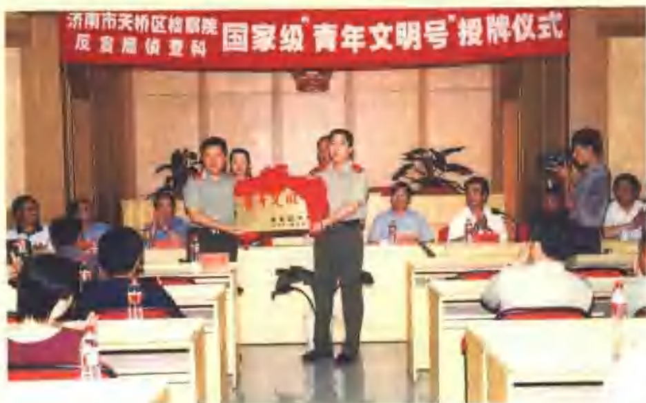
反贪局侦办科被团中央授予“青年文明号”称号挂牌仪式

天桥区人民检察院认真贯彻最高检察院“公正执法，加强监督，依法办案，从严治检，服务大局”的二十字工作方针。积极履行查办和预防职务犯罪、严厉打击严重刑事犯罪和诉讼监督三大职责，努力为党和国家大局服务，取得了办案的法律效果和政治效果、社会效果的统一，为维护社会政治稳定和经济健康发展做出了积极贡献。