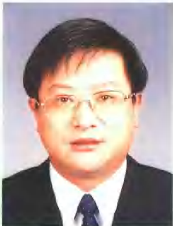
天桥区人民政府区长 雷天太