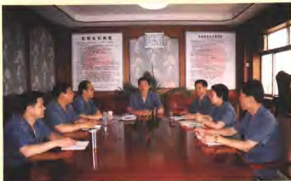
领导班子研究工作

天桥区人民检察院认真贯彻最高检察院“公正执法，加强监督，依法办案，从严治检，服务大局”的二十字工作方针。积极履行查办和预防职务犯罪、严厉打击严重刑事犯罪和诉讼监督三大职责，努力为党和国家大局服务，取得了办案的法律效果和政治效果、社会效果的统一，为维护社会政治稳定和经济健康发展做出了积极贡献。