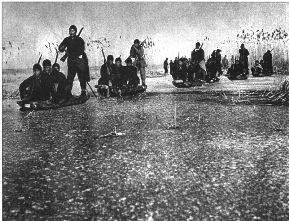
白洋淀结冰后，游击队用芦苇扎成冰爬犁继续战斗。

1938年4月，日军调集8个步兵联队（24个步兵大队）和支援部队共3万余人攻击晋东南，当地有八路军6个团，共产党领导的山西新军2个团，和国民党的第3、第17、第94、第169师以及骑4师。我军节节抗击，成功将敌军分割。集中4个主力团在长乐村，毙伤敌2200