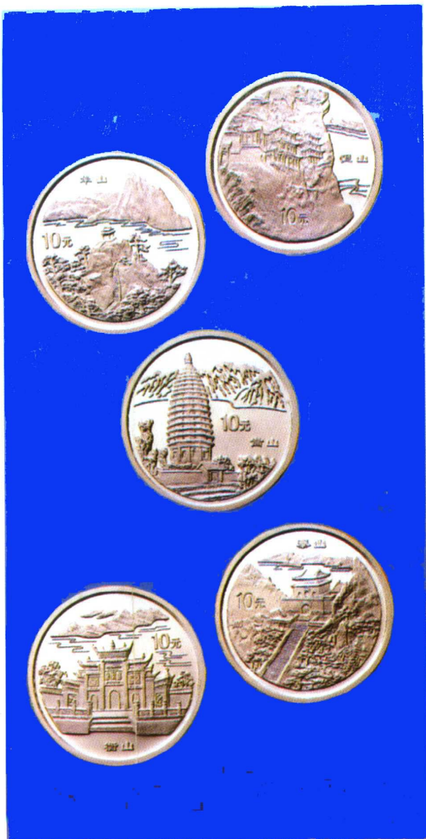
中国名山——五岳纪念银币