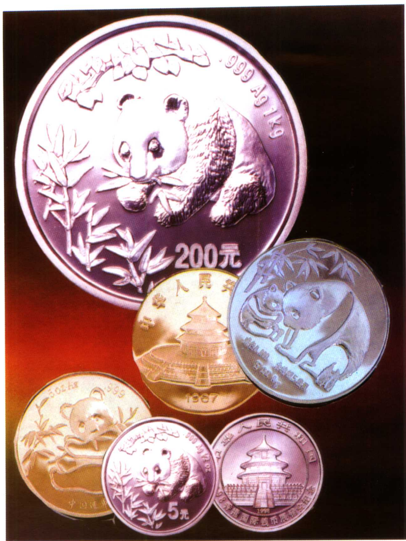
中国熊猫系列银币