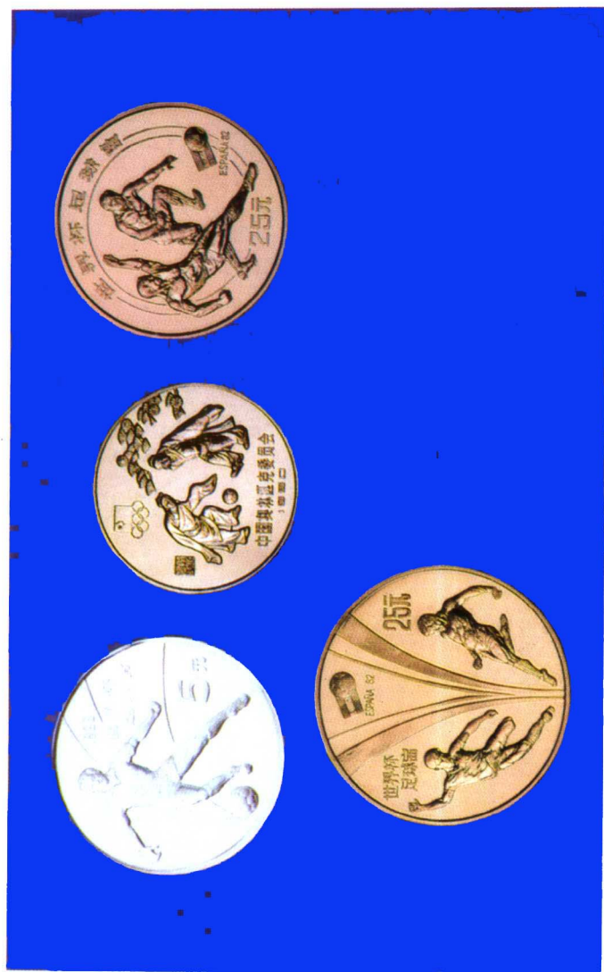
体育题材纪念银币