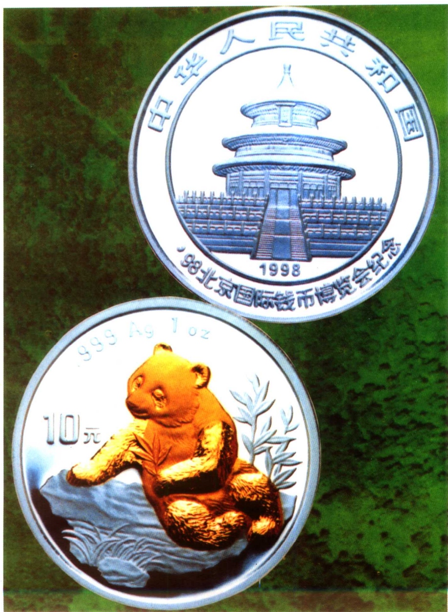
第一次发行的镀金银币