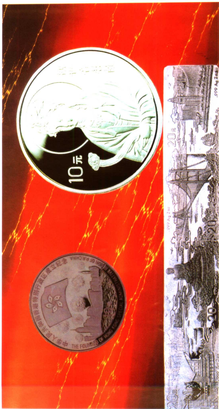
不同题材的纪念银币