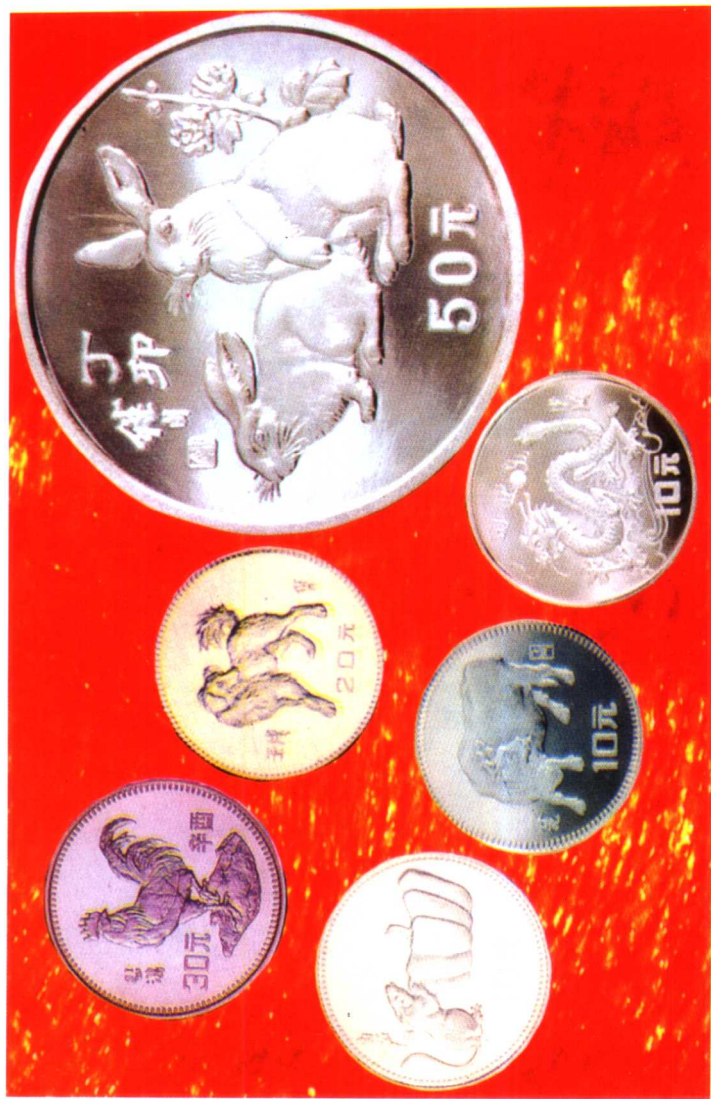
中国生肖年系列银币