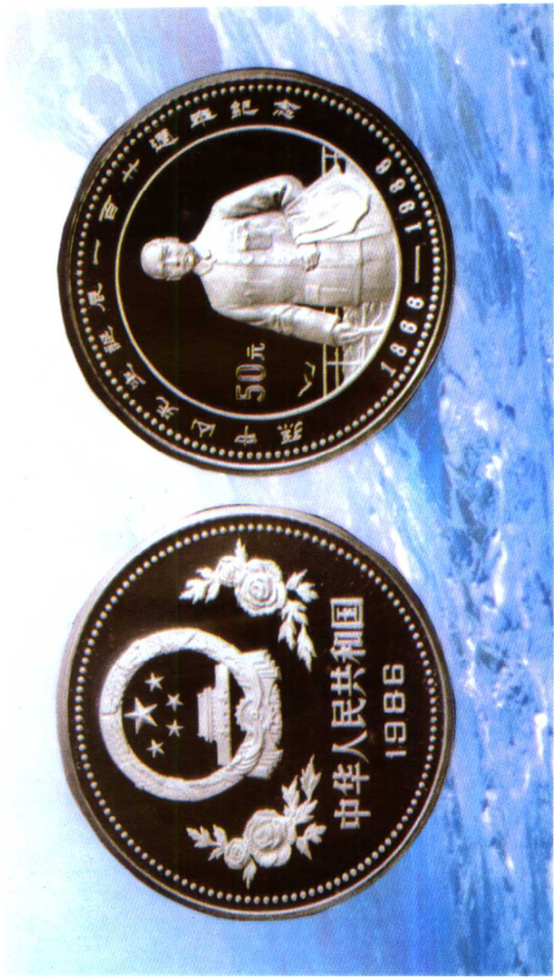
孙中山先生诞辰一百廿周年纪念银币