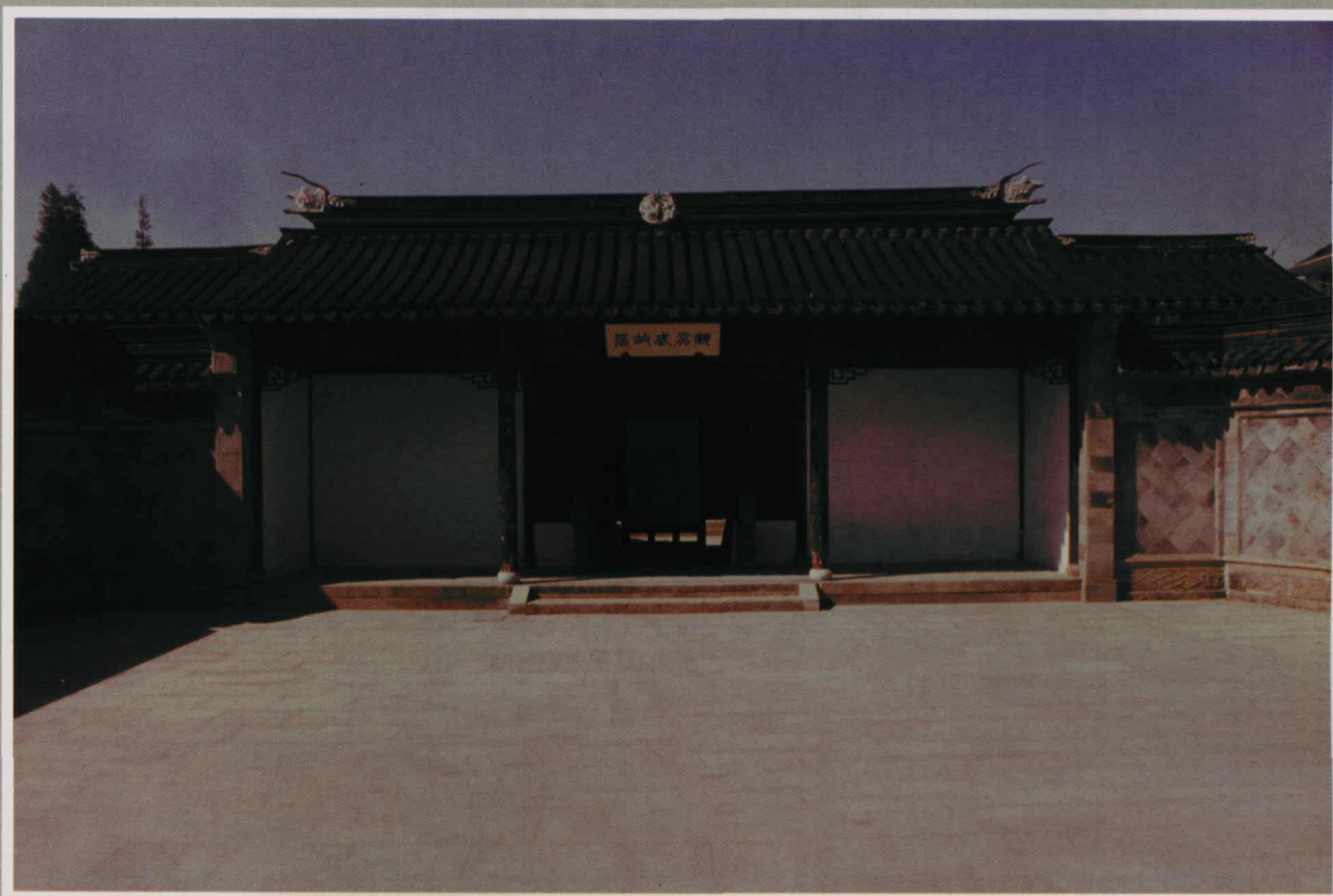
崑山千墩顧炎武故居