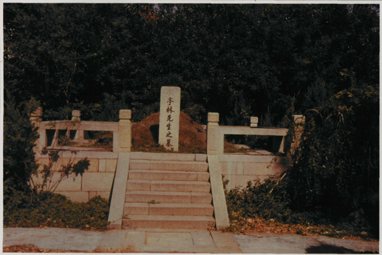
崑山千墩顧炎武墓