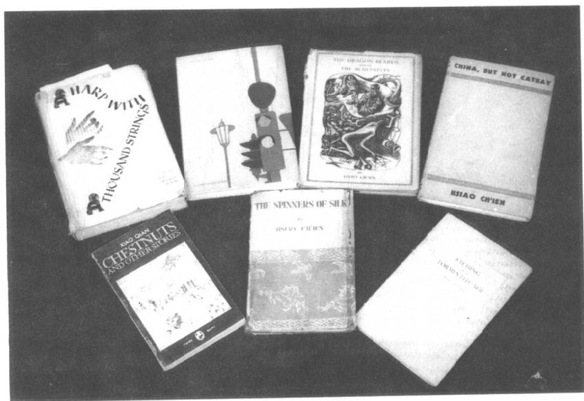
《土地回想录》部分译本。