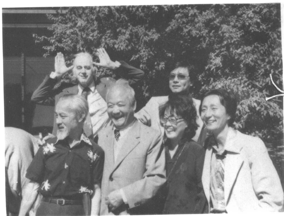
1979年与保罗·安格尔，聂华苓夫妇。