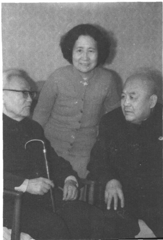
巴金与萧乾。 (中间站立者 为文洁若) (1985年4月)