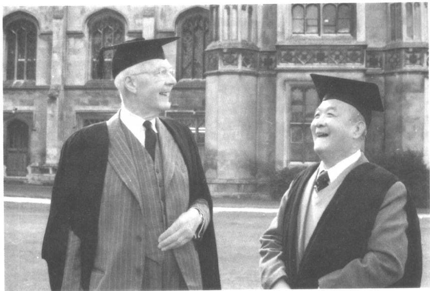
1984年在剑桥王家学院。