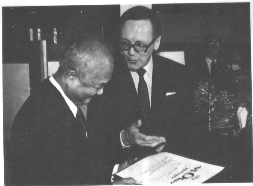
1986年12月2日荣获挪威王国政府“国家勋章”。