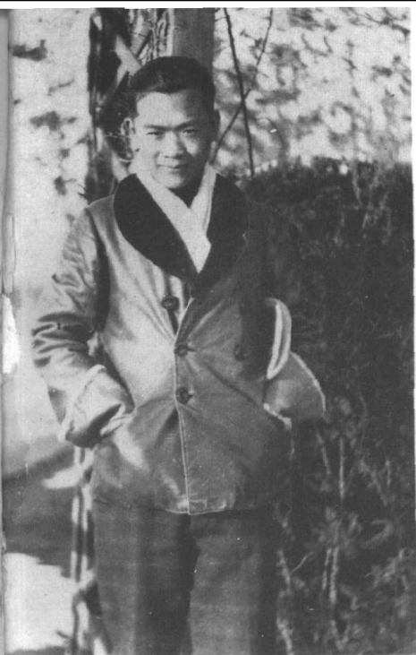
1934年在北平 京大学时。