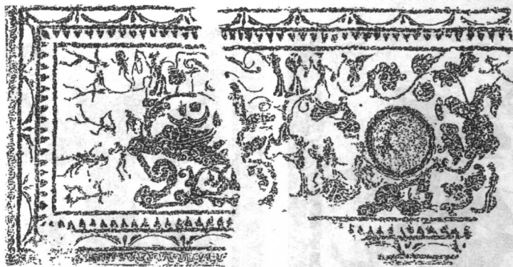
安丘董家庄汉墓前室封顶石中段