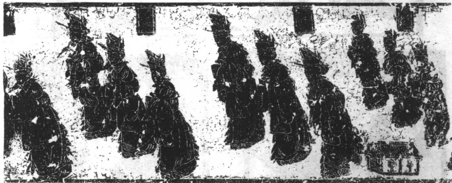
沂南汉墓前室东壁横额局部画像

也安排了门吏迎归、武库辟邪等图像，但这里的辟邪较之墓门辟邪更有人间气息，因为这里是人活动的场所。像沂南汉墓这样前中后室的墓葬形制，其实就是在前堂后室墓葬形制之前又套加了一个前室而已。有的墓葬在前室西侧放置一个祭台，则清楚地表明了前室的祭祀场所性质。安丘董家庄汉墓前室车马送行和迎归图像的设置，是墓门迎归的重复或者加强。(图 65)