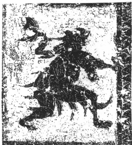
沂南汉墓后室北侧隔墙西面画像

墓底是墓室的最后部位，一般都是墓室后室的后壁，这里和墓门一样，虽然位于墓室的最后端，但也是与外界接触最近的地方，最容易遭受侵害的地方。而且，后室是墓主棺椁停放处，也是最需要安全防护的所在。因此，辟邪题材自然而然成为最重要的内容。安丘董家庄后室不但专门安排了一根辟邪的立柱，而且在东西两后室的北壁分别安排了铺首衔环、食蛇神怪、虎食鬼魅等图像。沂南汉墓则安排了手执斧钺凶猛砍杀的“方相”类神怪，以此来完成辟邪的职责。(图 64)