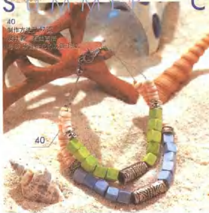
40 制作方法见 47 页 设计者 若生吉浩 与 39 项链搭配的皮革手链。