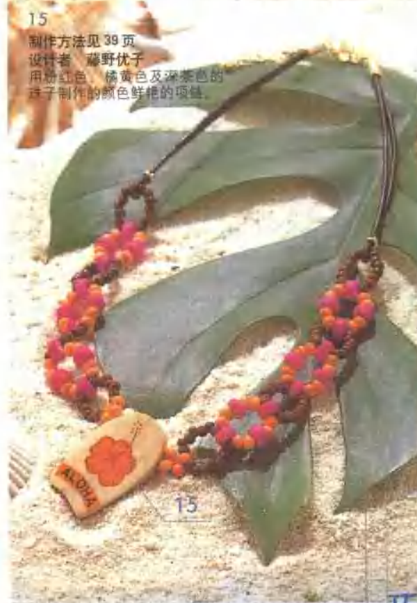
15 制作方法见 39 页 设计者 藤野优子 用粉红色、橘黄色及深茶色的 珠子制作的颜色鲜艳的项链