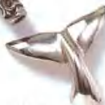
金属饰件 金属材料的饰件种类十分丰富。