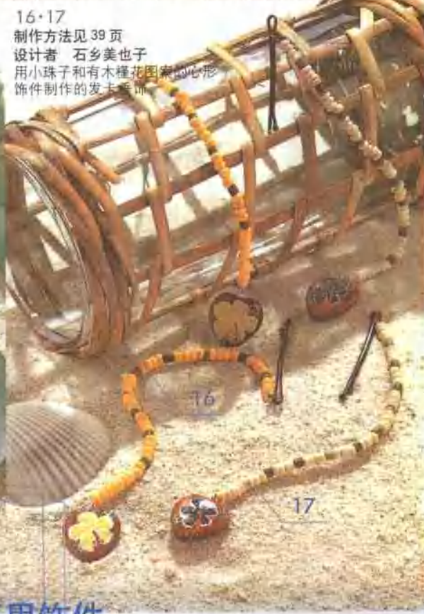
16-17 制作方法见 39 页 设计者 石乡美也子 用小珠子和有木槿花图案的心形 饰件制作的发夹等物