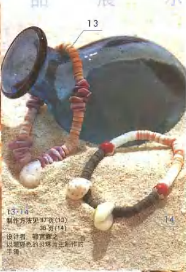
13-14 制作方法见 37 页(13) 38 页(14) 设计者 藤宫辉之 以珊瑚色的贝壳珠为主制作的 手链