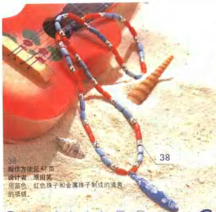
38 制作方法见 47 页 设计者 原田笑 用蓝色、红色珠子和金属珠子制成的清爽的项链。