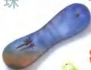
贝类饰件 在贝壳上绘制图案。