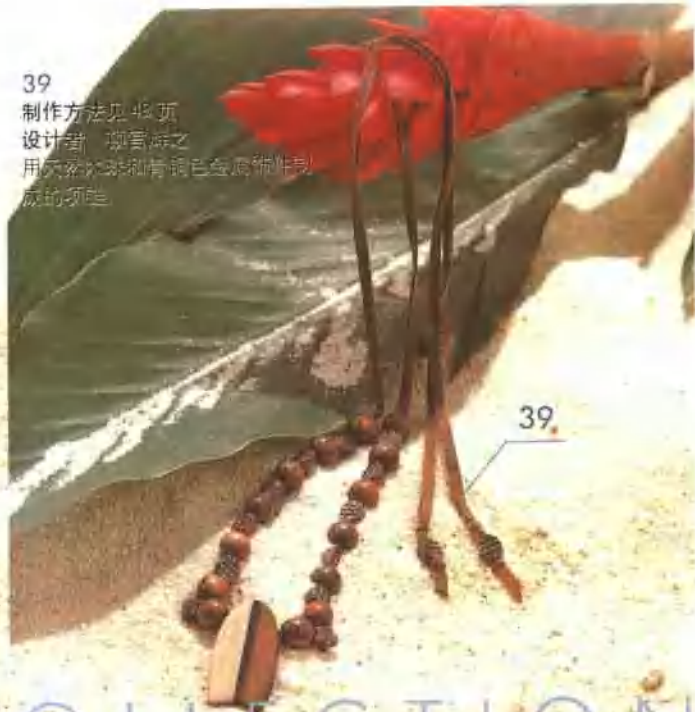
39 制作方法见 48 页 设计者 柳官海之 用天然木珠和青绿色贝壳制成的项链。