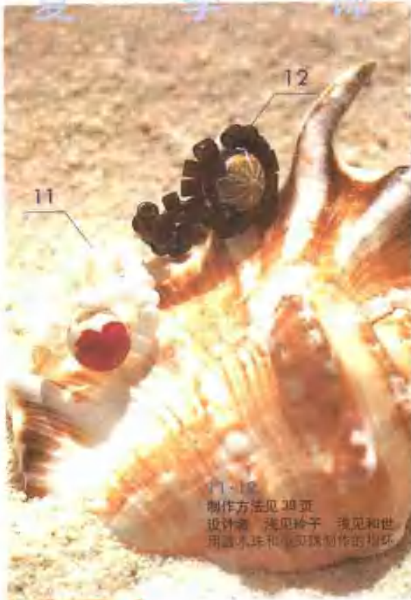
11-12 制作方法见 39 页 设计者 浅见铃子 浅见和世 用贝壳珠和贝壳珠制作的耳环