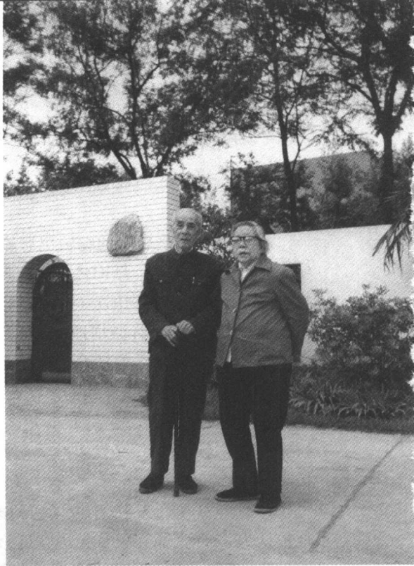
1990 年春，李俊民与夫人汪藜子在衡山公园

李俊民的革命生涯开始于他在武昌大学就读期间。1925 年春加入中国共产主义青年团，同年 9 月参加中国共产党，并任中共湖北省委组织部干事、秘书。1927 年 2 月，国民政府由广州迁武汉，黄