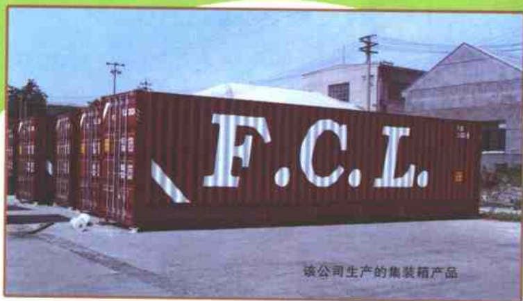
该公司生产的集装箱产品

青岛黄海集装箱有限公司建于1991年，占地面积28万平方米，建筑面积8万平方米，是生产国际标准集装箱和从事冲压、钣金件的专业工厂。集装箱产品全部出口国外，主要销往美国、日本、澳大利亚等国。