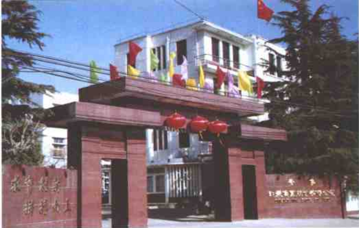
青岛即发集团总部