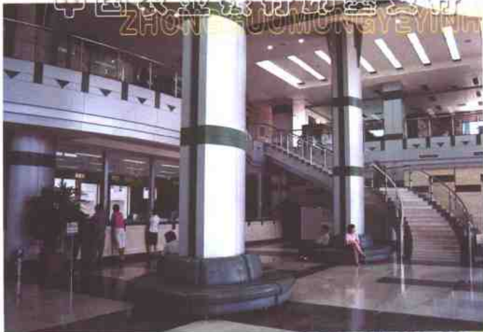
图为农行即墨市支行的营业大厅