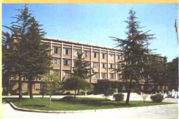
即墨市人民政府办公楼