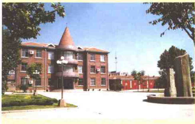
中共即墨市委办公楼