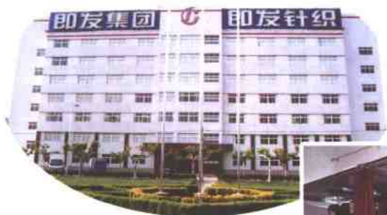
图为青岛即发集团技术开发中心大楼以及开发生产的部分产品。