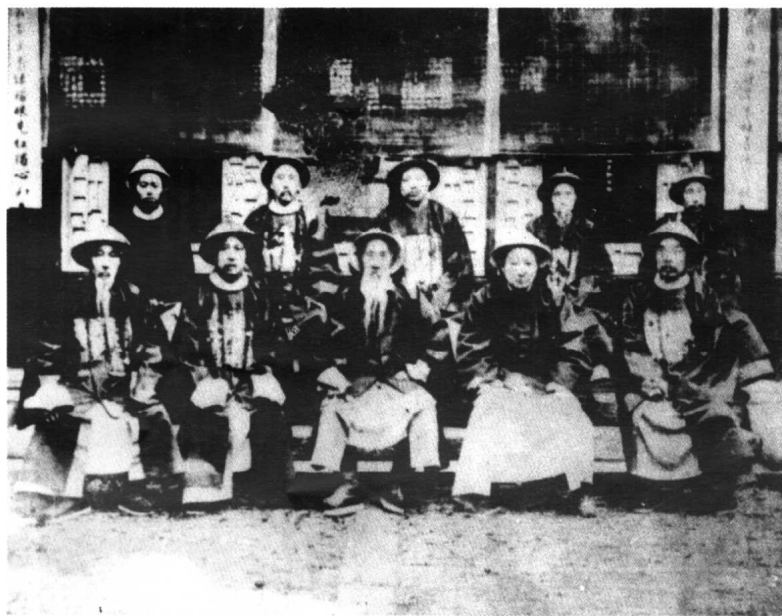
1904年张謇与张之洞等人的合影 前排右起：张謇、盛宣怀、张之洞、缪荃孙、魏光燾 后排右起：胡延、徐树钧、黄建管、蒯光典、魏允恭