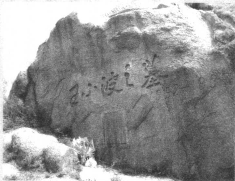
图 15 式 州