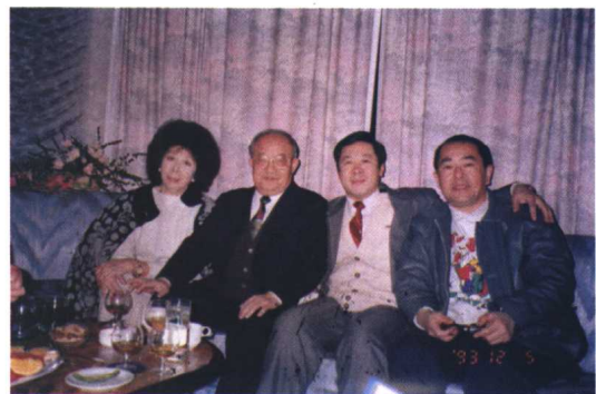
刘力与著名词作家乔羽夫妇和著名表演艺术家王铁成合影