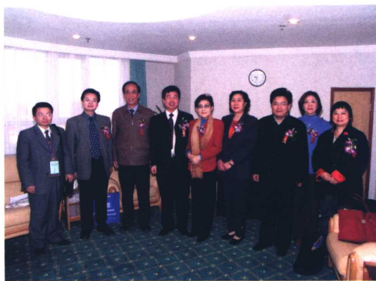
主创人员与特邀嘉宾在贵宾室合影留念