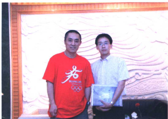
康艇与张艺谋导演工作期间合影