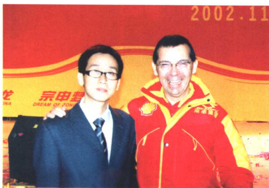
康艇与世界摩托车冠军队教练米歇尔先生合影