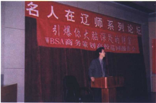
在辽宁师范大学作报告