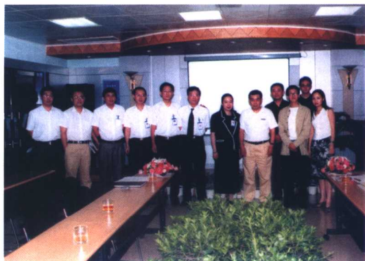
与宗申集团左宗申及高层领导合影