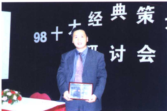
主持的策划案被评为“98十大经典策划案”