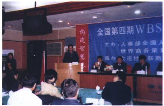
全国策划师特训班上致辞