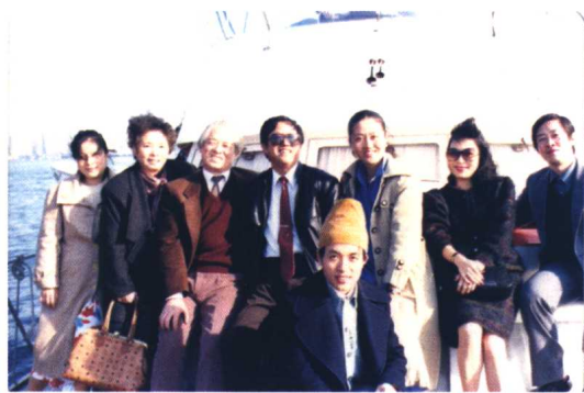
刘力与著名作家邓友梅、白桦、顾城（已故）、王安忆等在香港