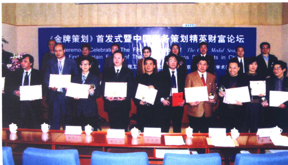
获奖代表与颁奖嘉宾留影 金牌策划专家暨中国商务策划精英