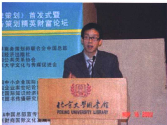
康艇策划师在北大金牌策划专家精英财富论坛发表主题演讲