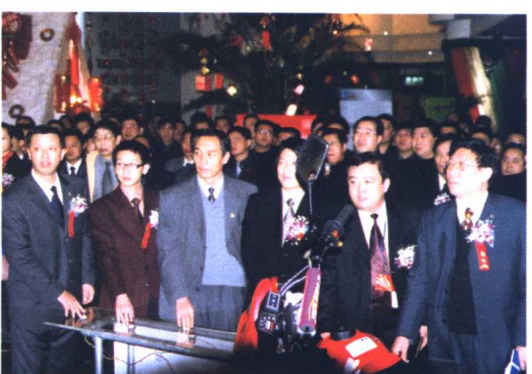
康艇先生为某企业(集团)新产品上市剪彩