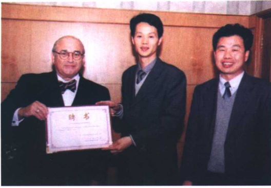
在WBSA史主席见证下郑学东策划师为世界顶级营销策划大师米尔顿·科特勒颁发聘书