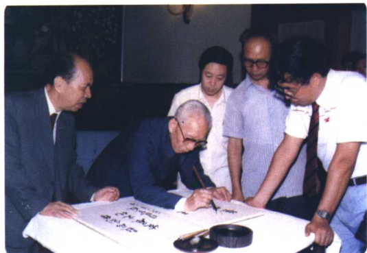
中华文学基金会成立时刘力请原国家副主席王震、政协副主席马万祺等国家领导人题词