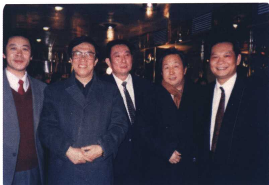
刘力与著名作家王蒙、丛维熙等在一起