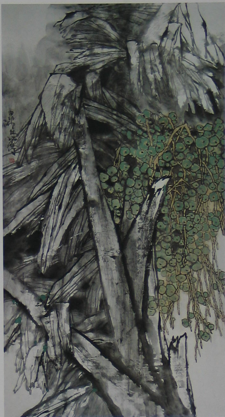
油棕树 2003年 纸本 180cm × 97cm

爱因斯坦在论及精神创造活动时,曾强调需要一种“内在自由”,当然这是一种精神的自然,它存在于独立的精神思考之中,不受常规和习惯性惯的羁绊。这种内在的自由乃是大自然的恩赐,使每个艺术家都应为之努力的目标,只有不断有意识地追求外在自由与内在自由的完美结合,才是完美与理想艺术实现的最佳途径。画家吉瑞森,才情横溢,富