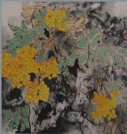
春光无限 2004年 纸本 90cm x 90cm

在这批作品中，画家摄取了热带植物中几组简洁的意象——交错纠缠的巨人根茎、苍翠欲滴的芭蕉，以及绚烂多姿的花朵、果实与形色相异的叶片……由它们组成了令人愉悦、赏心的色彩与图式。重要的是，画家在线、点、墨、色与花、果、叶、茎的表现中注入了不同寻常的诗境与激情，使作品洋溢着蓬勃的生机与现代的诗情。点、线、墨、色，仍然是吉瑞森作品最基本的构成因素。不论是横幅展开，还是竖幅呈现，画家都体现出一种自然的启示；强调