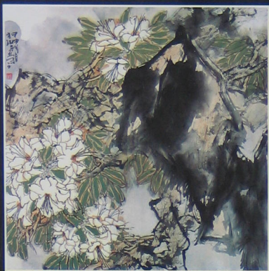
柱姆花 2004年 纸本 90cm × 90cm