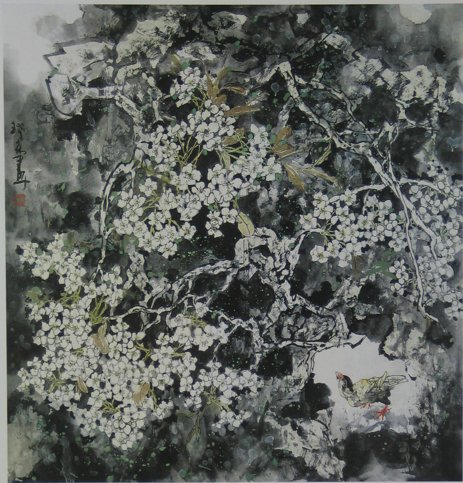
吉 瑞 森 写 意 花 鸟