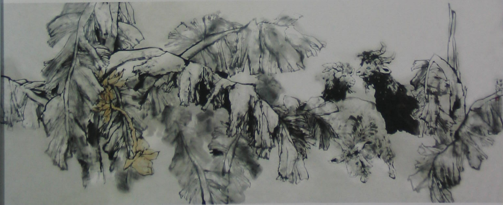
蕉荫三羊 2004年 纸本 145cm × 360cm