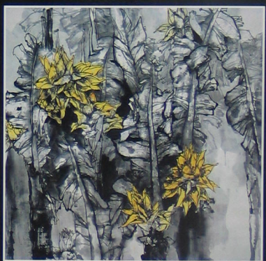
地涌金莲 2004年 纸本 180cm × 180cm