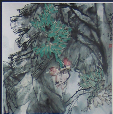
芭蕉 2004年 纸本 90cm × 90cm