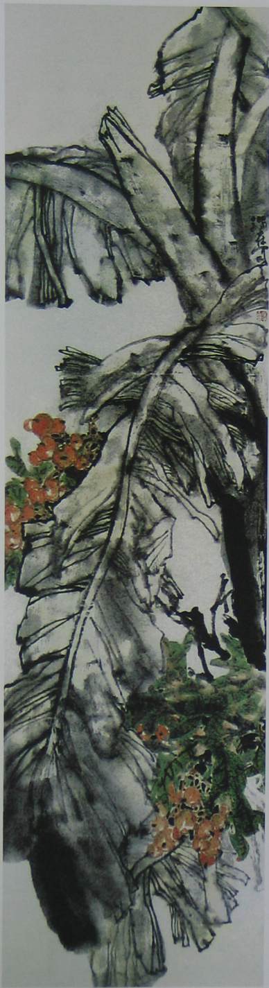
版纳系列之三 (右一)