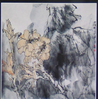
美人蕉 2004年 纸本 90cm × 90cm