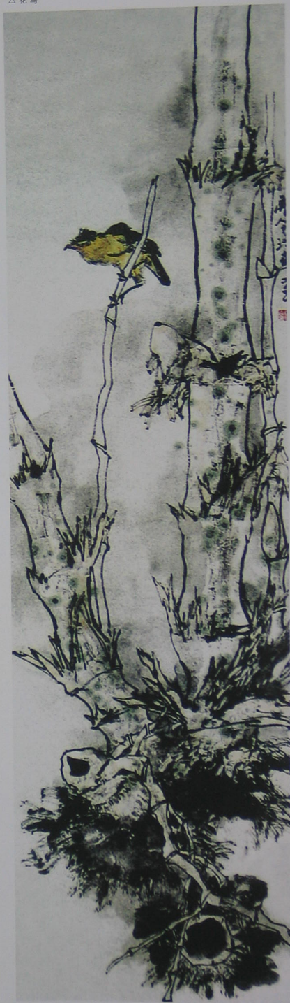
版纳系列之一（左一）