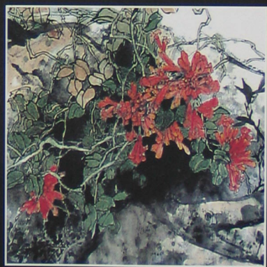
山涧(局部) 2003年 纸本