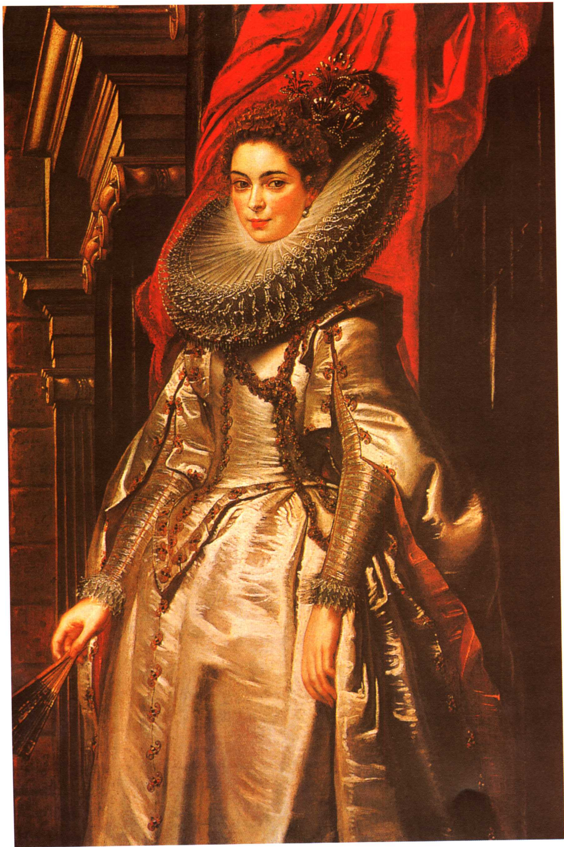
布里吉达·史皮诺拉·朵莉亚侯爵夫人