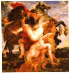
掠夺琉西波斯的女儿们