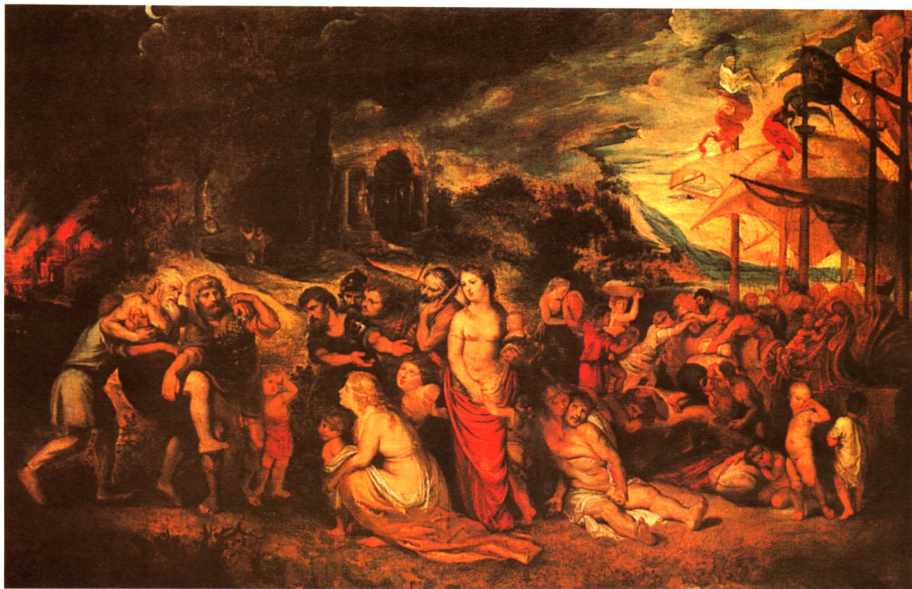
特洛伊大火后依尼亚斯的逃亡