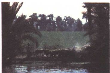
从尼波山眺望死海，以色列