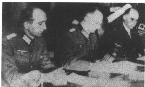
德军参谋长约德尔在兰斯签署投降书

国和日本的军队，尽管曾经穷兵黩武，不可一世，但他们无疑都成了法西斯主义和军国主义的牺牲品，他们在战争中引以为豪的所谓战斗精神，不过是人类精神的孽种和怪胎。正如《左