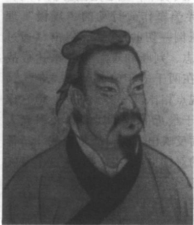
我国古代兵学鼻祖孙武

战争作为敌我之间的暴力对抗，是敌对双方战争力量的殊死较量和残酷角逐。从战争发展史看，战争力量的运用所释放的能量越来越大，涉及的领域越来越多，影响的范围越来越广，在两次世界大战中基本上达到了战争有始以来的顶点。正如上个世纪30年代德国的E·鲁登道夫在《总体战》中所言，现代战争呈现总体性特征，涉及国家的全部领域。 [1] 第二次世界大战后，尽管战争在局部地区，采取有限手段发生，但战争力量较量的综合性、残酷性并没有减弱。在近期发生的几场局部战争中，不仅传统的力量对抗仍在继续和增强，而且一些新的战争力量形态相继登上战争舞台，如高技术武器装备的使用、以网络为平台的信息战、空间技术在战场上的运用、新闻舆论控制权的争夺等，战争力量在新起点上的发展方兴未艾。