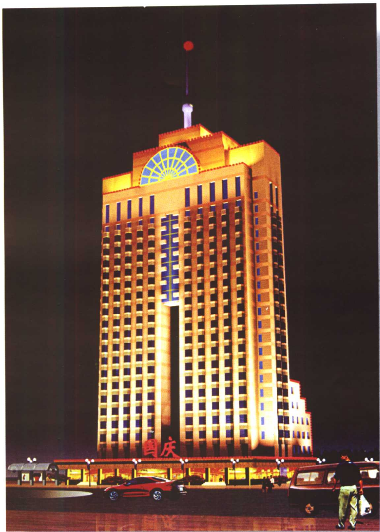
1996年，北京人民广播电台在国内首次开办7个系列台。图为广播中心大楼。