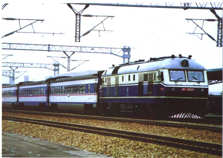
1987年7月,北京二七机车车辆厂试制的我国第一台大功率客运内燃机车新北京型5400马力八轴客运机车,顺利通过长距离运行试验,标志着我国机车生产水平进入新阶段。