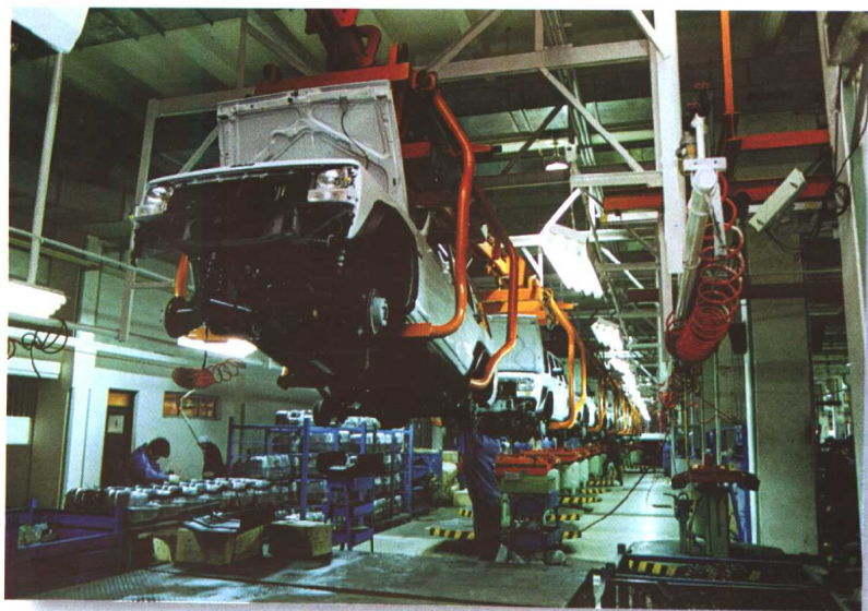
1984年1月15日，中美合营的北京吉普车有限公司开业。这是我国汽车工业第一家中外合资企业。图为总装生产线。