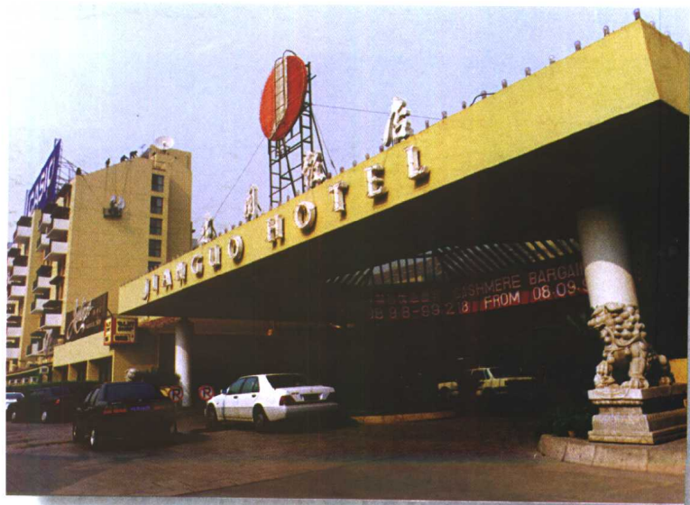
1979年10月，全国第一家合资饭店——建国饭店项目获得批准。