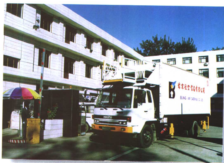
1980年5月3日，民航北京管理局和香港中国航空食品有限公司合资经营的北京航空食品有限公司在首都机场开业。这是我国《国外合资经营企业法》颁布后，在北京建立的第一家合资企业。