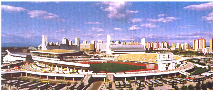
1990年9月22日~10月7日，第十一届亚洲运动会在北京举行。37个国家和地区的体育代表团参加了此次运动会。中国获183枚金牌，107枚银牌、51枚铜牌，金牌数名列榜首。图为国家奥林匹克中心田径场。