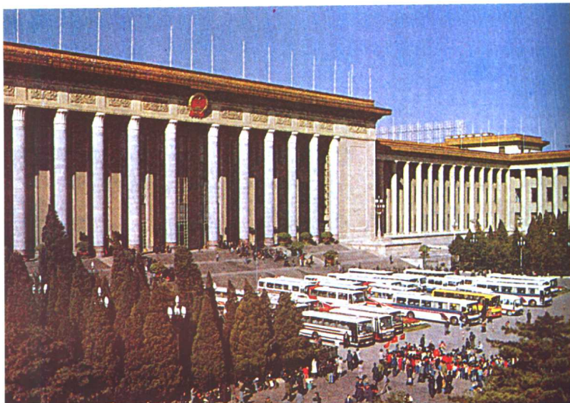
1959年9月24日，天安门广场扩建工程竣工，由原来的11万平方米，扩大为40万平方米。人民大会堂建成，目前我国最大的礼堂。