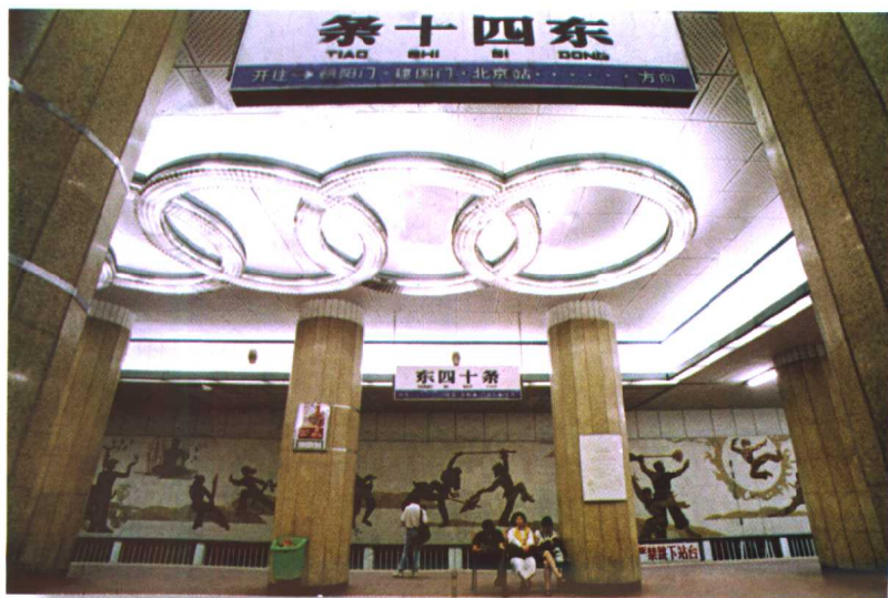
1969年10月,我国第一条城市地下铁道在京建成。图为随后建成的环线地铁车站。