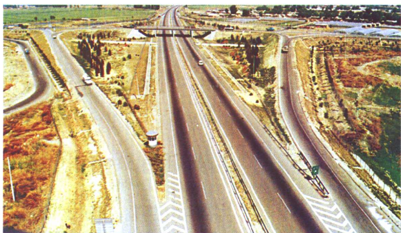
1990年8月25日，我国第一条利用世界贷款修建的跨省市高速公路——京津塘高速公路通车。