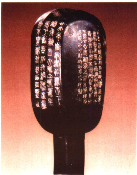
铜椭量（刻有秦始皇二十六年统一度量衡的诏文） 秦