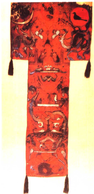
马王堆汉墓T形帛画 汉