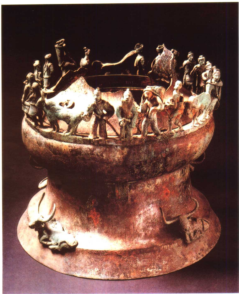
贡纳场面贮贝器 汉