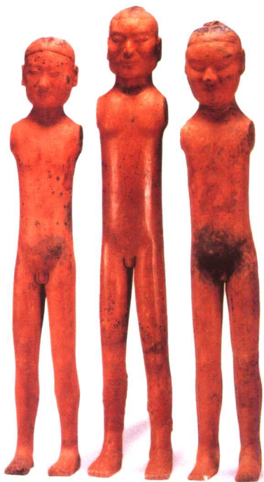
著衣式木臂陶俑(裸体俑) 汉