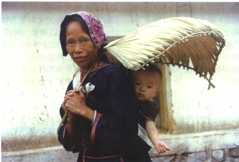
背着孙儿的黎族阿婆

根据这些事实，我们初步推断黎族的远古祖先大约是在新石器时代中期或更早一些从两广大陆沿海地区陆续迁入海南岛的，其年代相当于中原地区殷周之际，距今已有3000年以上的历史。