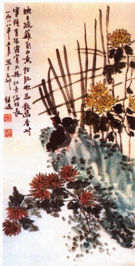
7 菊 王維逸