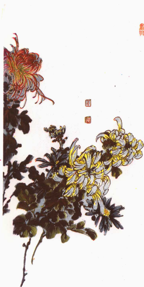
21 菊 孙菊生