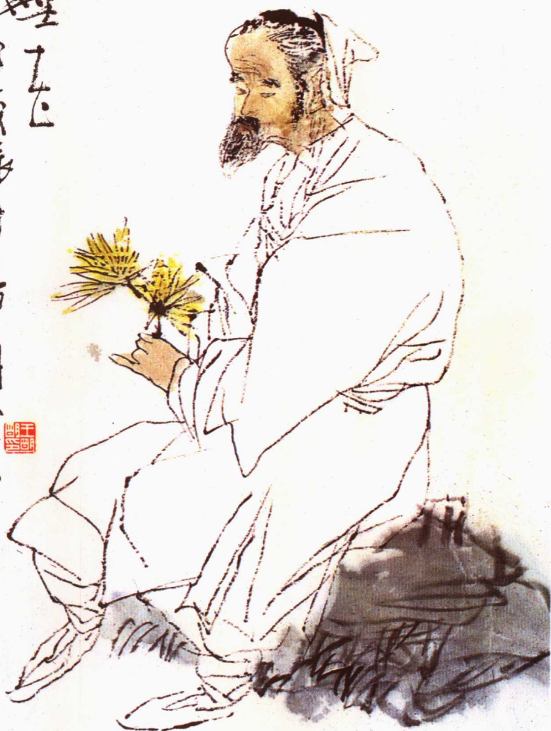
6 元稹诗意 王明明