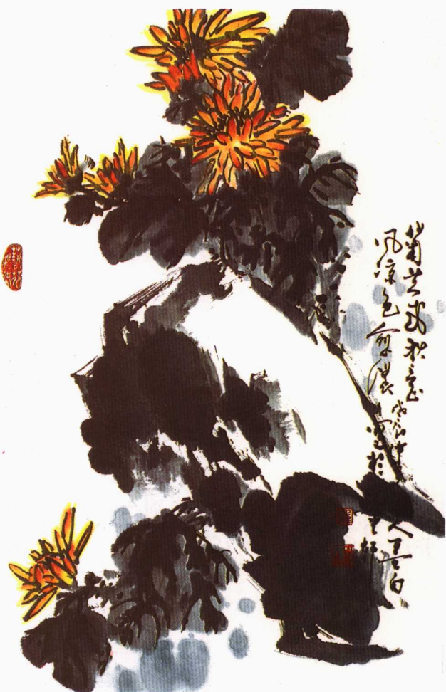
20 秋意 任连和