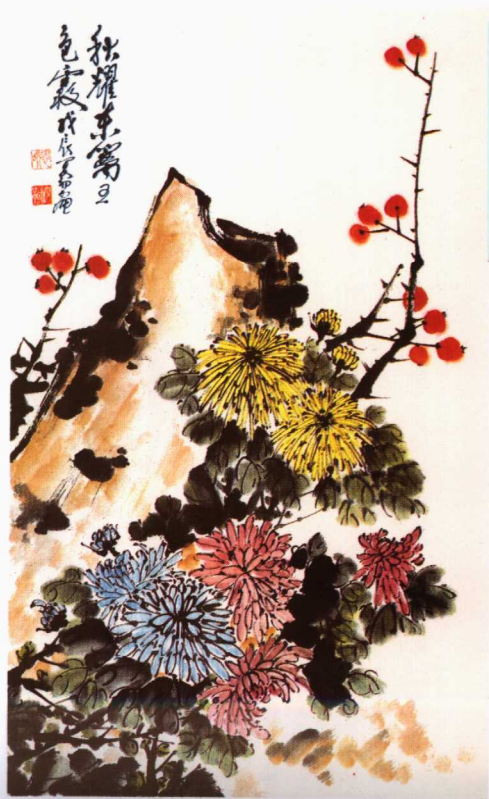
12 墨菊图 石宾