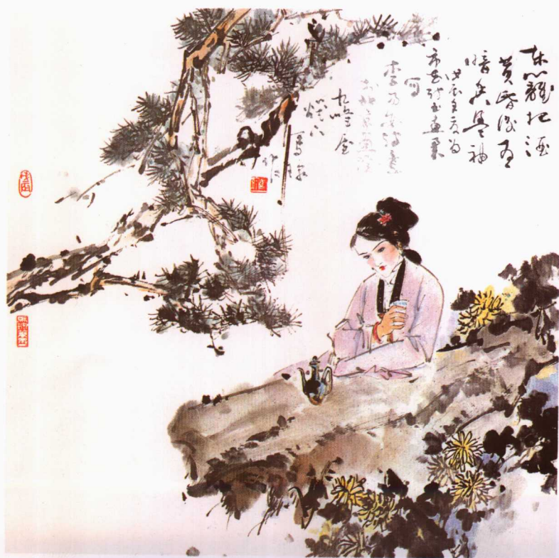
3 李清照诗意 马琮

秋風正酒 黃昏微雨 暗度無聲 亦不覺其 亦不覺其 亦不覺其 亦不覺其 亦不覺其 亦不覺其 亦不覺其 亦不覺其