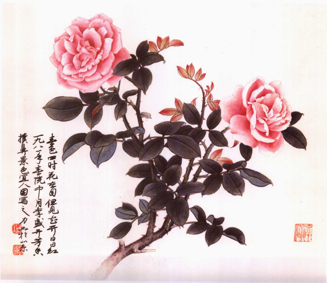
14 日日红 刘力上

喜色四时花自开 但见花开日日红 死生事院中月 李盛开芳景 摸鼻景色宜人 画之力 刘力上