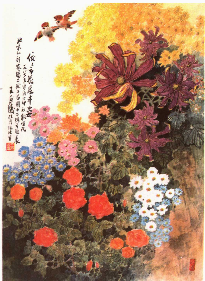
4 晚节本无瑕 王天一