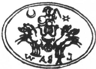
图2B 荣格的指环上的诺斯替宗教用的象征——亚伯拉斯神(Abraxas)

概念。为了探索人类心理的奥秘,荣格曾深浸于诺斯替教这一西方思想的潜流,以至一些西方学者认为,荣格既是科学的心理学家,同时也是“神秘主义者”,“他的手指上戴着一个诺斯替指环”(图二,AB)。 ①