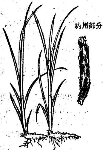
图 1 毛知母

毛知母最容易找，也好刨。春秋两季都能刨，春季由开 冻起，到清明节后苗高一寸左 右；秋季由秋分起到地上冻 止。山坡、地埂、道旁到处都 能找到它。用鐮刨或用鉄锹 挖，挖出后除去草秧，用手掰 掉根須子，忌用剪子或刀削 鉸，正象俗話所說：“知母好 刨，就怕拔毛”，必須用手掰， 刨采时，要注意保持原条， 不要刨断或碰断。生在山上 阳坡的皮細，毛根細黃；生在 山上阴坡的皮粗，毛根粗黑， 質量較次。除地势不同有区别 外，土壤也有关系，生在黃土