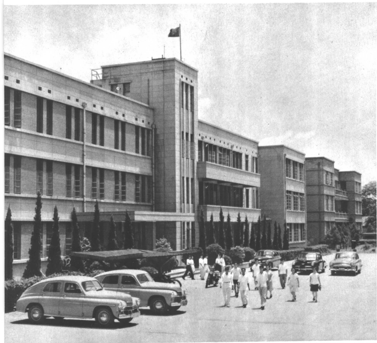
中国共产党江西省委员会办公大楼