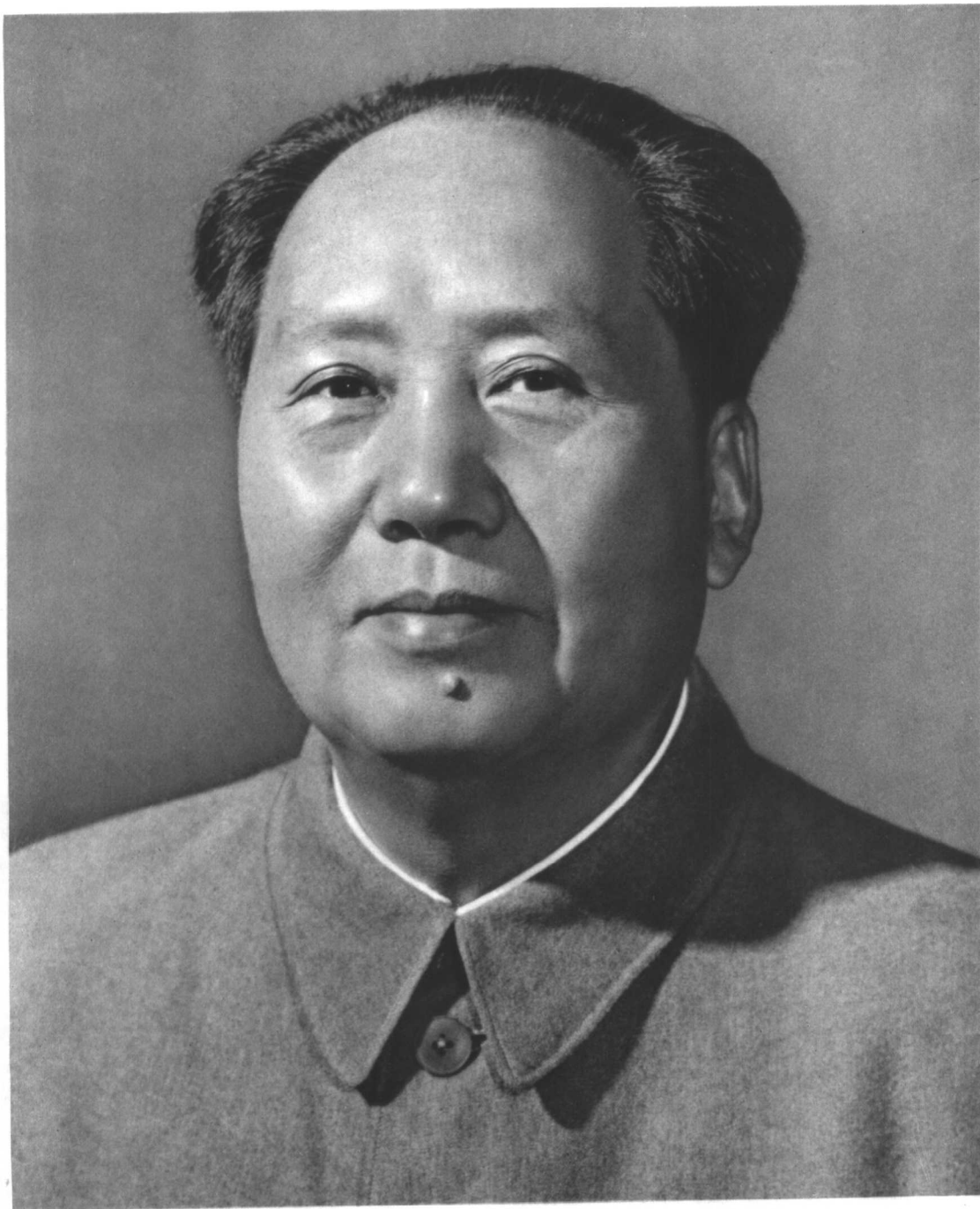
中国各族人民的伟大领袖毛泽东主席