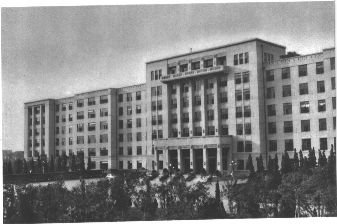
江西省人民委员会办公大楼