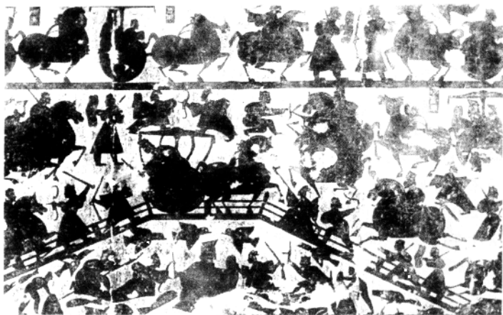
◎水陆攻战画像石(拓片)