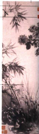
图 竹 菊 图