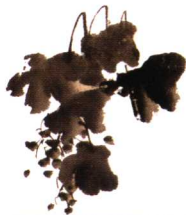
第一影响力艺术宝库

花鸟画的水墨和小写意画法元代开始流行，经明代早中期宫廷画家林良、吕纪和吴门画家沈周、文徵明的发展，到明代中后期的陈淳、徐渭终于完成了向水墨大写意的飞跃。其水墨与宣纸的材料特性，以草书入画的笔法，直抒胸臆的抒情性都发挥到了史无前例的新高度，成为明代绘画中最有革命性、最具发展前途的创造。徐渭是水墨大写意画派的确立者，对后世的八大山人、石涛、郑燮、李文膺、清末海派直至现代齐白石、李苦禅等人，都产生了深远影响。史称这一画派为“青藤画派”。