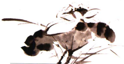
第一影响力艺术宝库

质。徐渭的水墨写意法，不仅将技巧升华到新的高度，还强化了文人画特色。他笔下的形象“不求形似求生韵”，以寥寥几笔，倾倒墨汁的淋漓水墨，浑然天成地传达出物象的神韵，将写意法演变为大写意法，真正达到了“逸品”和文人画所标榜的“逸笔草草，不求形似”。