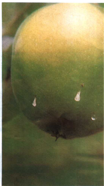
幼虫入果孔溢出泪珠状汁液