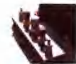
照牌与石五供 ..... 37