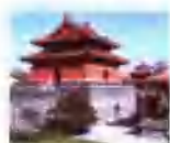
大明楼 ..... 38