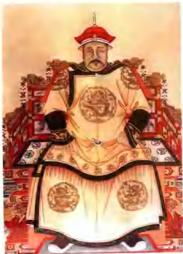
清太宗皇太极朝服像

清太宗爱新觉罗·皇太极即清太祖爱新觉罗·努尔哈赤的第八子，满族。他是一位能弯弓射大雕的赫赫有名的“马上皇帝”。是中国古代杰出的政治家、军事家。1592年（明万历二十年）10月25日申时生于赫图阿拉城。自幼才华出众，善于骑射，青年时追随其父为统一女真各部和创建清政权南征北战，足智多谋；英勇善战，屡立战功，被封为和硕贝勒。1626年（后金天命十一年）9月，在沈阳故宫大政殿即后金汗位，年号天聪。1636年（清崇德元年）在崇政殿称帝，改后金为清，改元崇德。他重整八旗制度，增建蒙古八旗和汉军八旗，继续完成对黑龙江和吉林东境女真各部的统一，加强对东北边疆各族的统治。为了争夺对全国的统治权，曾多次对明朝用兵。1643年（清崇德八年）8月，卒于清宁宫，终年52岁。庙号“太宗”，谥号“应天兴国弘德彰武宽温仁圣睿孝敬敏昭定隆道显功文皇帝”。