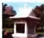
焚帛亭 ..... 32