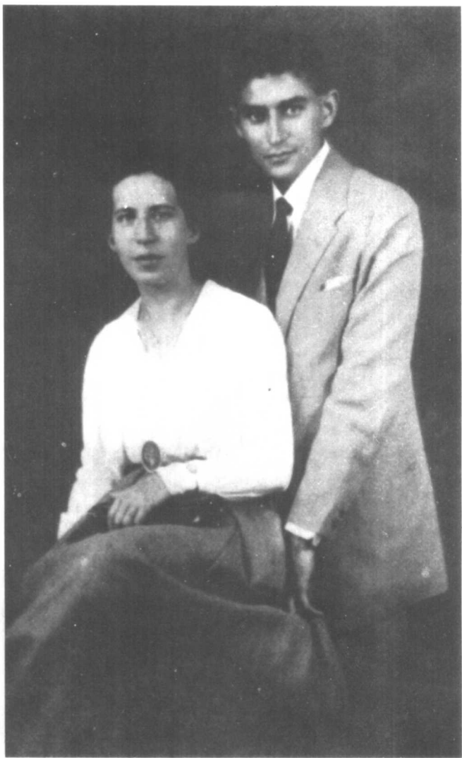
卡夫卡与未婚妻费丽莎。卡夫卡同她两次订婚，又两次退婚，对费丽莎的感情充满矛盾，深恐娶了费丽莎对他的创作产生不良的影响。