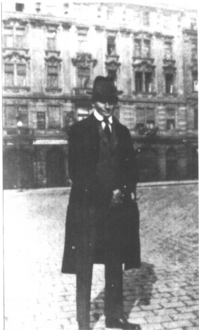
□广场，布拉格—1922摄。卡夫卡一生想要逃离的地方，然而宿命是无法逃离的，布拉格就是他的宿命。