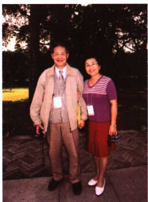
中国文物学会会长、著名古建筑专家罗哲文先生与作者合影，并为本书题词。