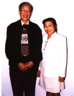
原国家文物局顾问，著名文物学专家谢辰生先生与作者合影。