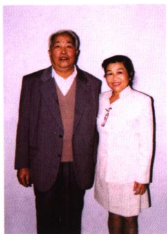
原国家文物局副局长，著名考古学专家黄景略先生与作者合影。