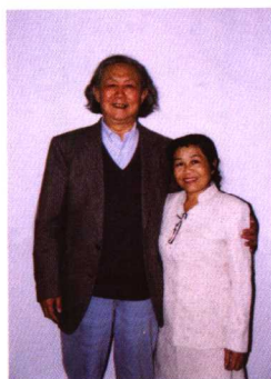
原故宫博物院副院长，著名玉器专家杨伯达先生与作者合影。