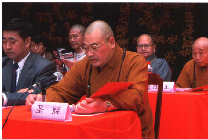
中国佛教协会 常务副会长圣辉法 师致词