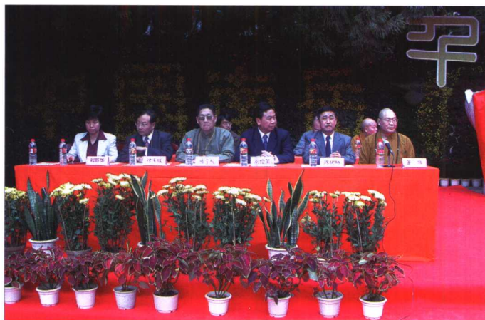
2003年度“南岳 佛教论坛”开幕式