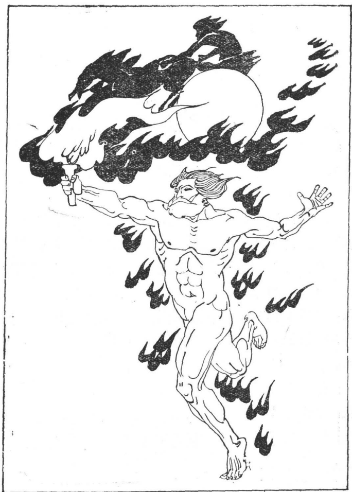
普洛米修带着火种奔向人间。