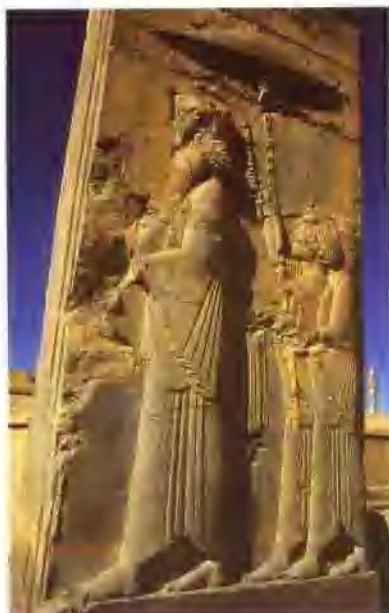
（上图）波斯萨珊王朝三王宫，529-1851年。