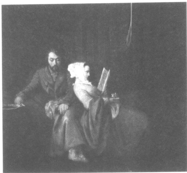
海涅和玛蒂尔德，1851年巴黎。