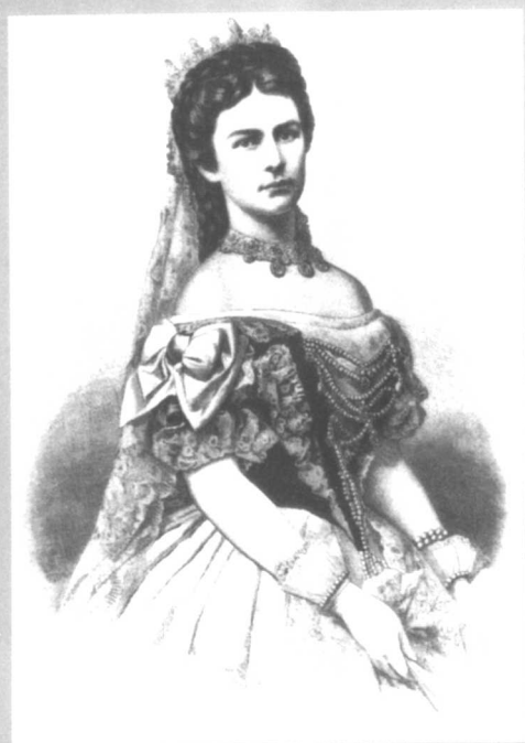
海涅崇拜者奥地利皇后伊丽莎白。