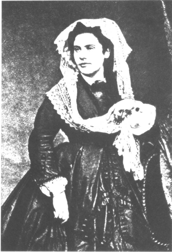
海涅之妻玛蒂尔德。